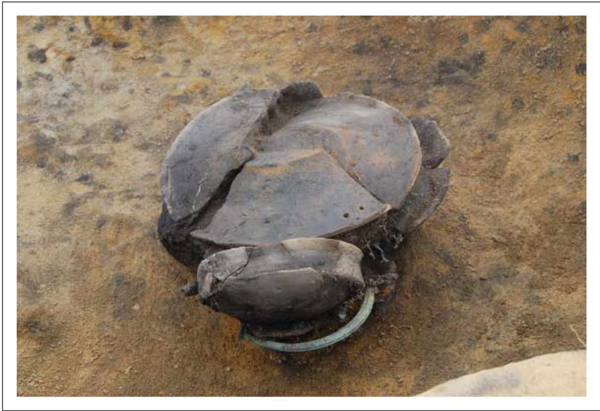
Fig. 2 : La sépulture 155 en cours de fouille.

le bois ou le cuir. Ces éléments sont néanmoins à prendre en compte, notamment pour la poignée de l'épée et son fourreau. Sur au moins deux couteaux, des traces nettes de bois fossilisé par les oxydes de fer sont visibles, ce qui suppose que ceux-ci n'étaient pas placés sur le bûcher.