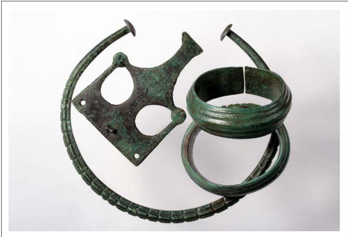
Fig. 3 : Torque, agrafe de ceinture et paire de bracelets en alliage cuivreux de la sépulture S155.