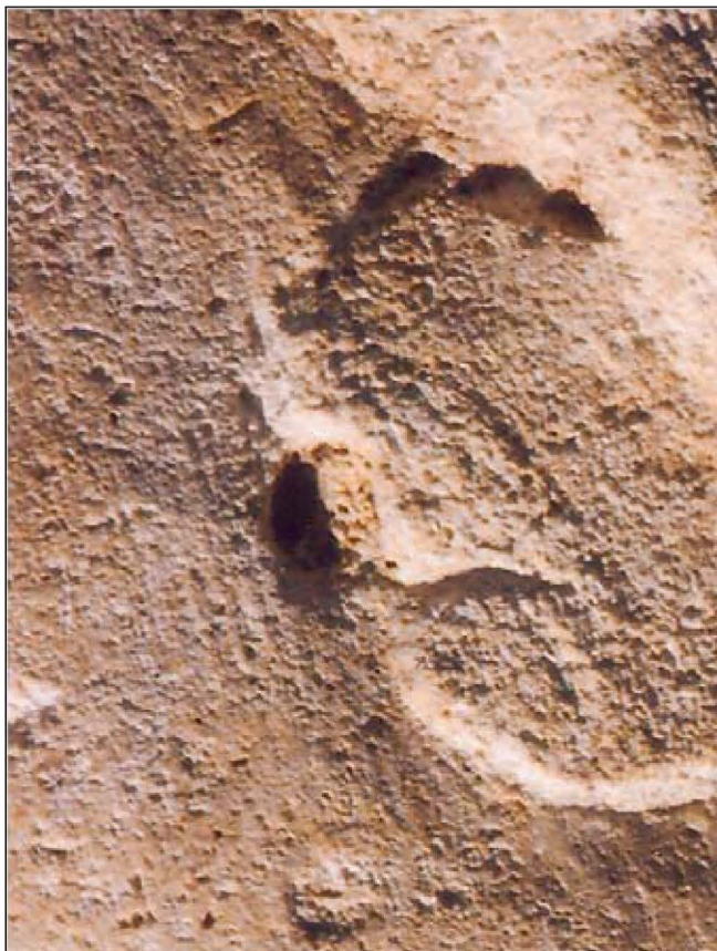
Fig. 2. Traces de ripe en avant de l'oreille gauche.

Par chance, cette tête sculptée présente une surface relativement bien conservée et, malgré l'égrisage dont elle a fait l'objet, de nombreuses empreintes d'outils y sont encore visibles : ce qui incite à penser que ce travail de finition n'avait pas pour but de les éradiquer en totalité, mais plutôt de les atténuer de manière à ce qu'elles ne soient pas perceptibles à distance. Nous avons cependant distingué certaines traces appuyées résultant d'une taille décorative : les traces de ciseau, visibles à l'arrière et sur le côté gauche de la tête, n'ont pas été adoucies. Elles figurent certainement la chevelure. Outre les nombreuses empreintes de ciseau, cette analyse fine de la surface a permis de remarquer des traces d'outil qui n'avaient pas été vues jusque là : il s'agit de fines stries millimétriques, parallèles et plus ou moins longues, particulièrement visibles en avant de l'oreille gauche (Fig. 2). Ces stries sont caractéristiques de la ripe. Cet outil, dont les variantes anciennes ne présentent qu'un seul tranchant de 1 à 3 cm de large, peut comporter de 3 à 12 petites dents de géométrie variable (Bessac