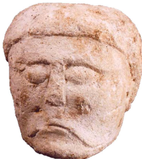
Fig. 1. Photographie de La tête gauloise découverte à Poitiers

Une sculpture gauloise en pierre a été découverte en 2002, sur le chantier du futur théâtre, rue de la Marne à Poitiers (Fig.1). Il s'agit d'une tête cubique présentant un visage typiquement laténien : yeux en amande, sourcils et moustache en légères esses, nez trapézoïdal peu proéminent, oreille en forme de « haricot » et coiffure au bol limitée au dessus de la nuque. Elle a été trouvée dans la tranchée d'un mur correspondant à la construction d'un sanctuaire entre 60 et 80 ap. J.-C. Cependant, des indices, notamment la présence de cavités liées à la dissolution de la pierre sur deux de ses faces, mais aussi son style, indiquent une date de fabrication bien antérieure au I er s. av. J.-C. : cette sculpture a été probablement réalisée entre le II e et le I er s. av. J.-C.