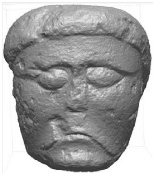
Fig. 4. Vue (de face) de la représentation virtuelle 3D de la tête de Poitiers (société Optic 3D)

Une représentation virtuelle en 3 dimensions de la tête de Poitiers (Fig. 3 et 4) a été réalisée par la société Optic 3 D, actuellement basée à Châtellerauld (Vienne). Le relevé de la sculpture a été effectué grâce à un système de projection de lumière structurée 3 qui, parmi ceux que nous avons pu tester, est le plus prometteur. La résolution du relevé est suffisante pour percevoir sur la représentation virtuelle, les traces de ciseau sur la coiffure (Fig. 4, cercle blanc) mais aussi celles de ripe. Nous avons ici choisi délibérément une représentation purement géométrique : les variations