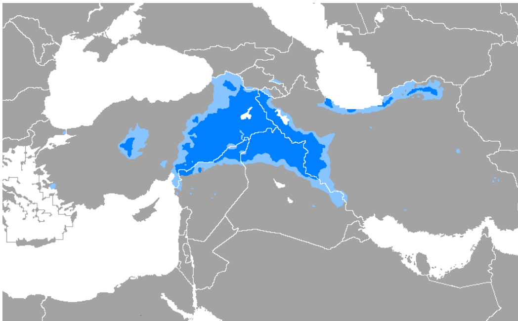
Les parlers kurdes reportés sur une carte politique. Source : voir note 3 .

Cependant, il ne faut pas confondre la dispersion géographique d'une « langue commune » avec les frontières politiques, dont on sait bien qu'elles changent, ou qu'elles sont soumises à d'autres forces que celles qui font les communautés linguistiques. Le cas des langues kurdes en est un exemple bien connu : inquiets de l'importance et du caractère « communautaire » des langues kurdes, des états aujourd'hui partiellement kurdophones comme la Turquie, l'Iran et l'Iraq évitent avec soin de faciliter le chemin d'une autonomie ou d'une indépendance des populations kurdophones 2 .