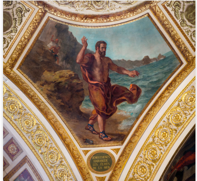
◀ Figure 1 : Jean-Jules-Antoine Lecomte du Nouÿ, Démosthène pratiquant l'art oratoire, Collection privée, 1870 (domaine public).