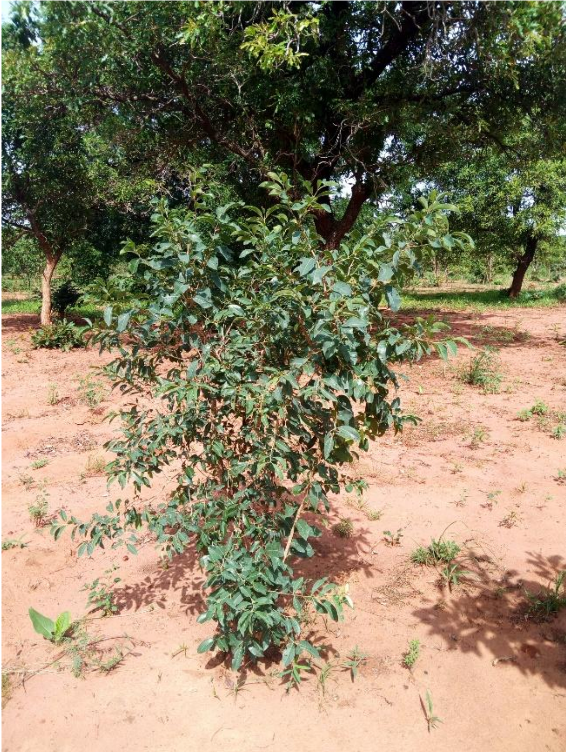
Figure 3- Jeune individu de Pteleopsis suberosa poussant dans une jachère. (Orodara, juillet 2019)