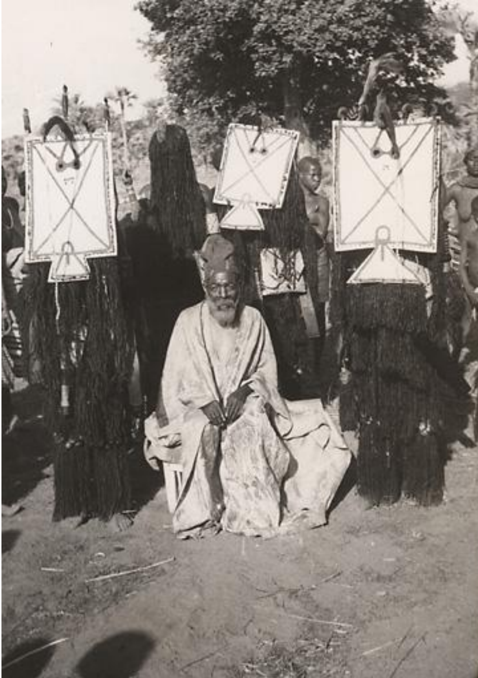
Figure 2- Masques représentant des calaos avec leurs costumes de fibres de Pteleopsis suberosa lors d’une initiation donoble chez les Toussian (père Nadal, Toussiamasso, 1950)

En termes de services écosystémiques, cette espèce rend donc un service d’approvisionnement à des fins culturelles religieuses. Cet usage peut également être qualifié de « récréatif » car la cérémonie donoble , très appréciée, est également une réjouissance. De plus, le costume des masques a une forte valeur identitaire car quand d’autres sociétés de la région (comme les Bobo et les Bwaba) habillent aussi certains de leurs masques de robes de fibres, ils emploient une autre plante, Hibiscus cannabinus , qui est cultivée à cet effet.