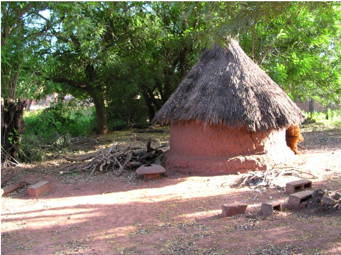
Figure 5. Dans le bosquet sacré du Dwo , maisonnette contenant les objets sacrés du Dwo dans un quartier d'Orodara (mars 2010)