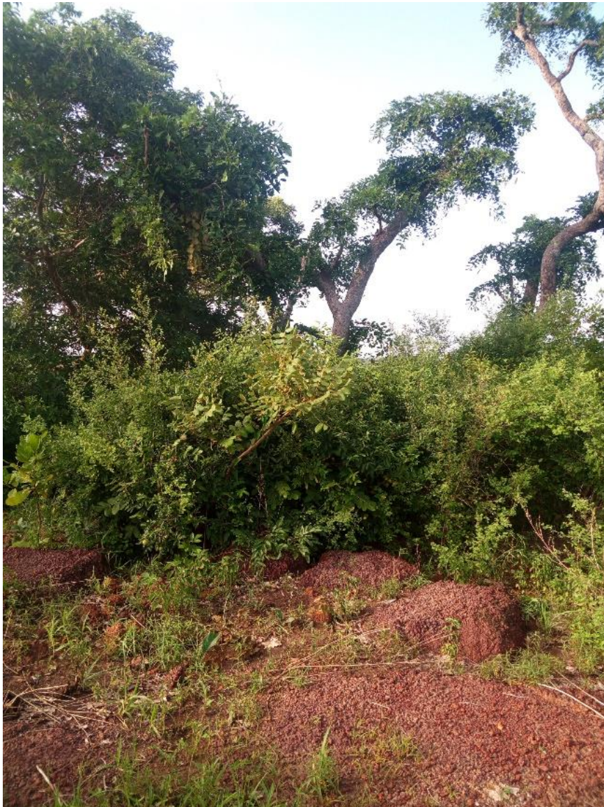
Figure 4. Site de préservation de Pteleopsis suberosa dans la localité de Diossogo près d'Orodara (juillet 2019)

des terres, avec essartage, créait autrefois de nombreux espaces de jachère favorables à l'espèce. Avec la croissance démographique et l'introduction puis l'extension de l'arboriculture, la superficie des formations naturelles et des jachères a fortement diminué. Ainsi, dans la petite commune de Kotoudéni près d'Orodara, celles-ci sont passées de 76 % du territoire en 1955 à seulement 26 % en 2010 (Bene et Fournier, 2014). Bien avant que la plante ne vienne à manquer, les responsables du culte du Dwo ont décidé de mettre en place des zones où la collecte de l'espèce serait interdite, excepté à l'occasion de donoble . Un marquage par arrachage de l'écorce sur le tronc de certains arbres a été pratiqué sur le pourtour de ces zones. Ce n'est cependant pas par une mise en défens matérielle que les « vieux du Dwo » font respecter l'interdit. L'élément dissuasif est la présence d'un génie sur le site car ce dernier peut causer des problèmes (maladies, malheurs) aux contrevenants ou même les tuer. Lors du choix des sites de défens, les responsables se sont en effet assurés par une divination de la présence d'un génie. Une végétation localement plus dense (Figure 4) est toujours pour les Sèmè l'indication que le lieu est potentiellement habité par un génie et donc dangereux.