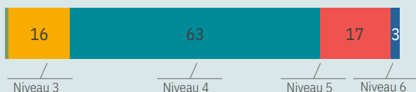
Répartition des FCIL par niveau (%)