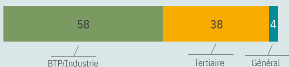
Secteurs d'activité visés par la FCIL (%)