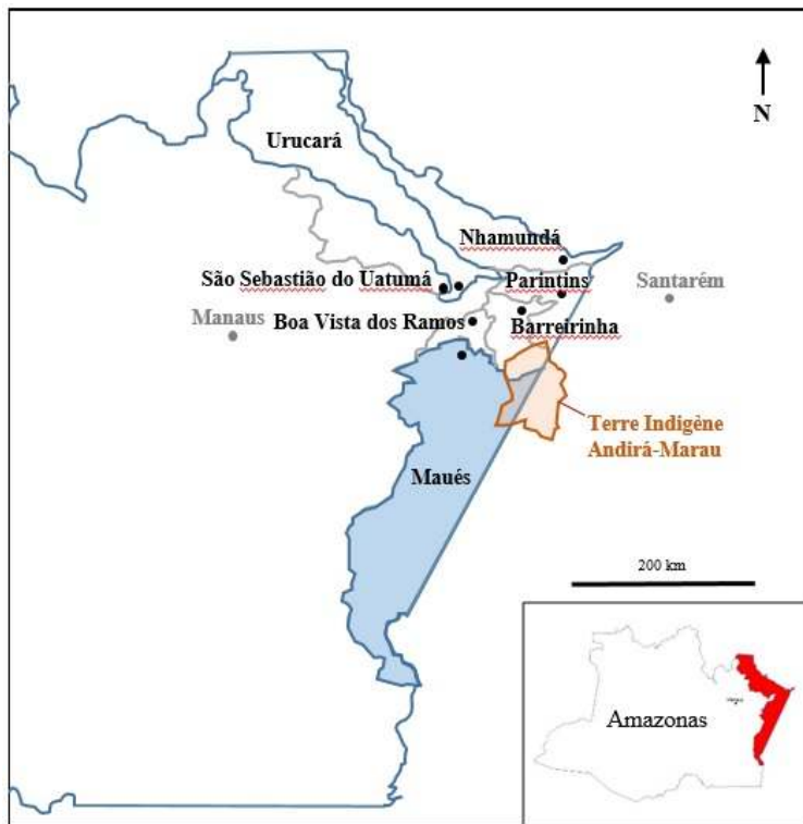
Figure 4. Territoire de la citoyenneté du Bas-Amazonas.

Le territoire de la citoyenneté du Bas-Amazonas. Il rassemble sept municipes, dont celui de Maués