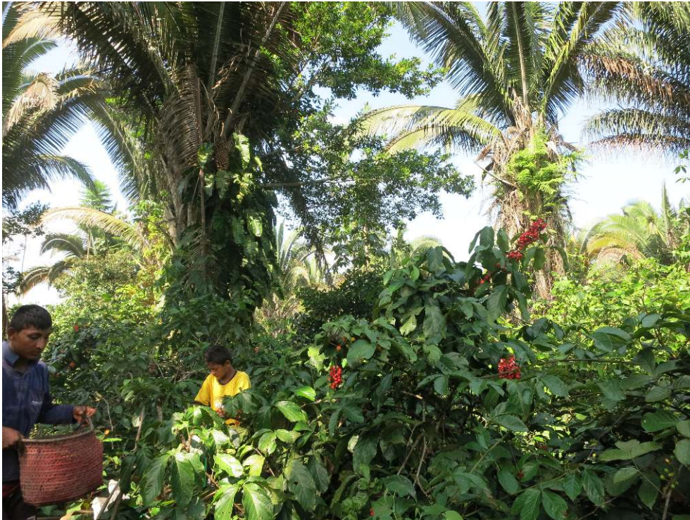
Figure 3. Cueillette du guaraná à Maués

Cueillette manuelle des fruits de guaraná dans la communauté Menino Deus, Maués, novembre 2014