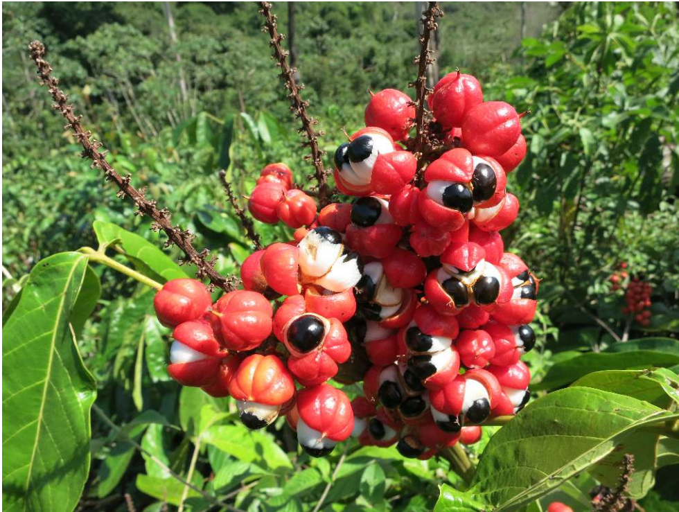
Figure1. Fruits de guaraná

Une grappe de fruits de guaraná. La « pupille » noire correspond à la graine qui sera extraite, puis lavée et torréfiée.