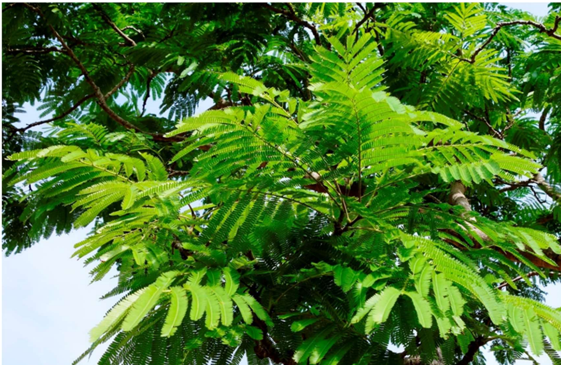
Figure 8. Feuilles bipennées de Parkia biglobosa ( doomu ) dans l'ouest du Burkina Faso © Anne Fournier, novembre 2018