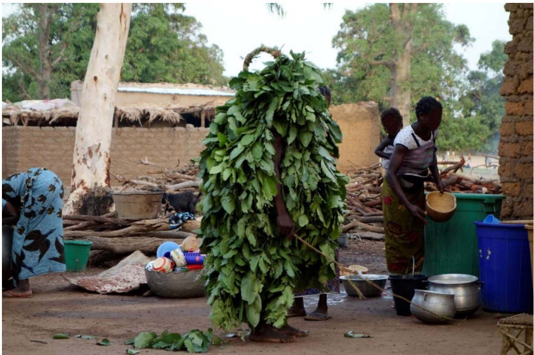
Figure 4. Masque tɛɛhũ , venu saluer dans une cour, commune de Bondoukuy © Anne Fournier, mai 2017