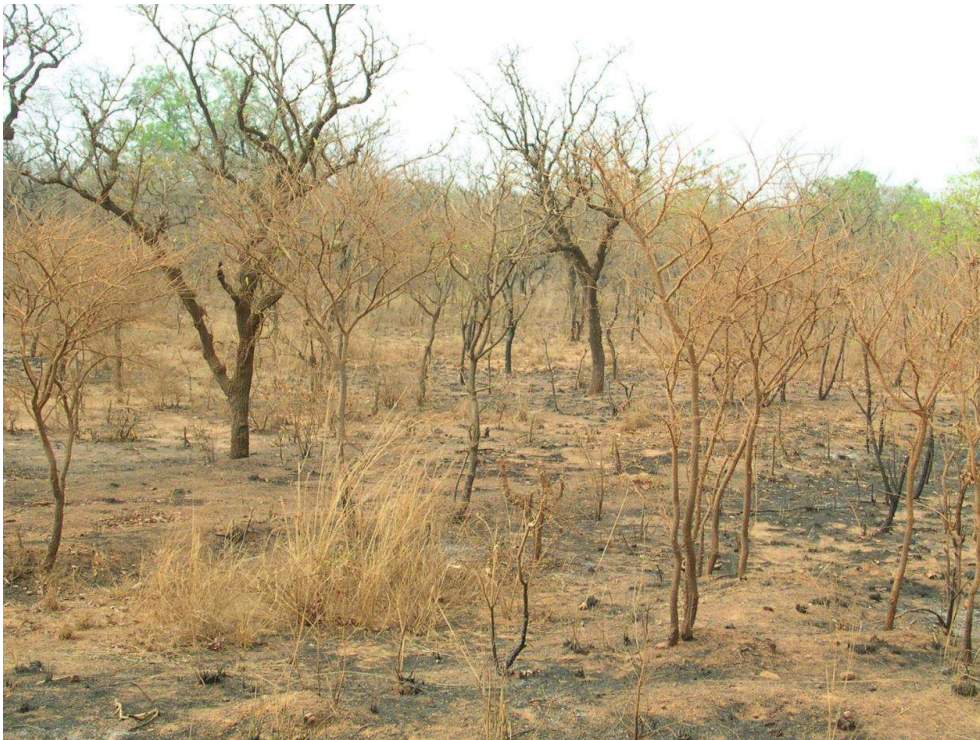
Figure 6. Paysage de fin de saison sèche (janvier) dans la commune de Bondoukuy © Anne Fournier, 5 mars 2008

seraient trop fragiles pour servir à la fabrication des masques ; quand elles sont à point quelques semaines plus tard, elles ont pris une teinte plus foncée, mais n'ont pas perdu leur brillance. Lors du renouveau, les premières feuilles de péemu sont également parmi les plus précoces, mais elles viennent après celles de téehú ; leur sortie est plus progressive et leurs folioles n'offrent pas les mêmes qualités de brillance (Figure 7). Les feuilles de cette espèce fanent moins vite que celles de téehú et les masques peuvent donc être portés plusieurs jours alors que le masque téehú doit être fait de neuf chaque matin. Le renouveau saisonnier de la nature offre ainsi une belle métaphore végétale du cycle de renouvellement des générations d'initiés, tandis que l'ordre d'acquisition des deux premiers masques reproduit l'ordre de production des premières feuilles chez les deux espèces. Le type de répartition spatiale des espèces « parle » également : à l'image d' I. doka qui pousse en groupe, c'est collectivement que la promotion subit son initiation et porte ce premier masque. À l'image de l'espèce K. senegalensis dont les pieds poussent isolés, le forgeron, à qui le masque péemu fait allusion, assure tout seul le rôle de témoin dans les rituels du Doò .