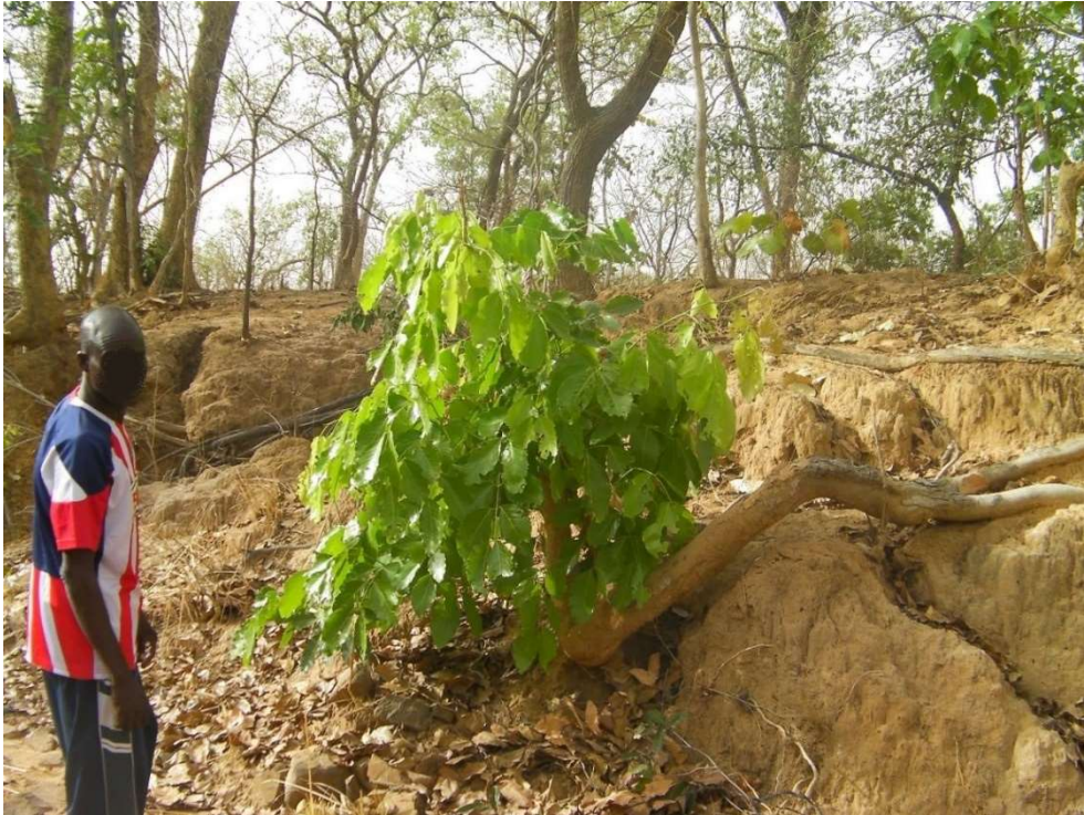
Figure 7. Jeunes feuilles d' Isoberlinia doka (tɛɛhú) sur un drageon en fin de saison sèche, commune de Bondoukuy © MNHN Camille Devineau avril 2012

C'est le masque doomu qui est jugé le moins beau des quatre, il est même souvent carrément qualifié de vilain. Ses feuilles sont « un peu plus claires » ou « un peu plus jaunes » que celles de tɛɛhú et de péemu (Figures 8 et 9). Par moquerie, on le surnomme « le lépreux » 11 ( bwèré ), allusion à son caractère « incomplet » puisqu'il ne cache pas tout le corps et l'on ajoute qu'« il est fait à la va-vite ». Les feuilles composées bipennées du néré ( P. biglobosa ), avec ses pinnules largement écartées et ses foliolules qui atteignent tout au plus deux centimètres de long, se prêtent assurément moins bien que celles d'autres espèces à la fabrication d'une couche végétale opaque. Le « masque lépreux » présente en revanche l'avantage d'être le plus facile et le plus rapide à fabriquer. On n'a besoin que de peu de feuilles et ce sont celles d'une espèce utile 12 conservée dans le parc agroforestier jusqu'aux abords du village.