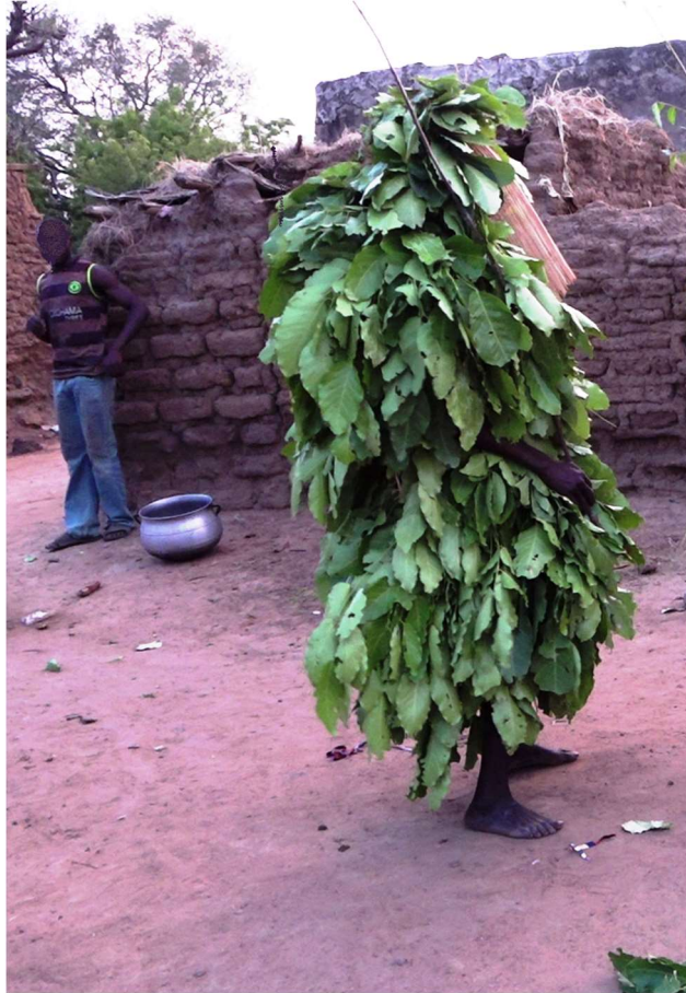
Figure 3. Masque tɛɛhũ commune de Bondoukuy. © Anne Fournier, mai 2017