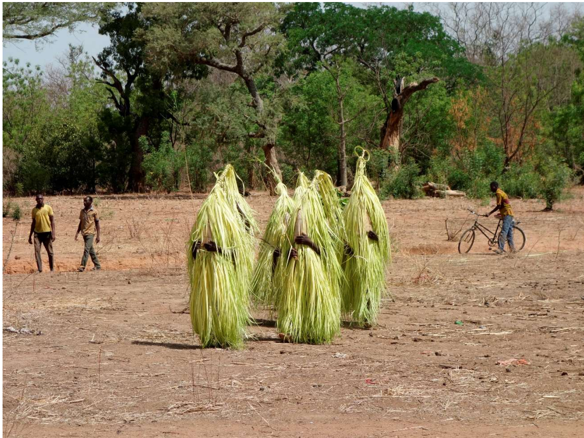
Figure 5. Masques kòohó , commune de Bondoukuy © Anne Fournier, mai 2017

Le troisième masque, kòohó (Figure 5), n'existe que dans certains quartiers. Il « appartient » en titre aux jeunes gens encore incomplètement initiés ( doýáwa du tableau I), déjà possesseurs de téehú et péemu , mais qui n'ont pas encore transmis ces masques à la promotion suivante. L'un des rôles du masque kòohó qui accompagne le parcours des néophytes depuis leur sélection et leur réclusion jusqu'au plein achèvement de leur initiation est de les brimer rituellement. Son acquisition marque pour les néophytes avancés la dernière étape avant l'accès au statut d'individus pleinement initié. Ce masque est fait selon le même principe d'assemblage que les précédents, mais avec les feuilles du bourgeon apical du palmier Raphia sudanica . Son aspect est toutefois très différent car il se compose d'étroites lanières de palmes, longues d'environ un mètre, et non de folioles relativement arrondies ne dépassant pas 25 centimètres de long.