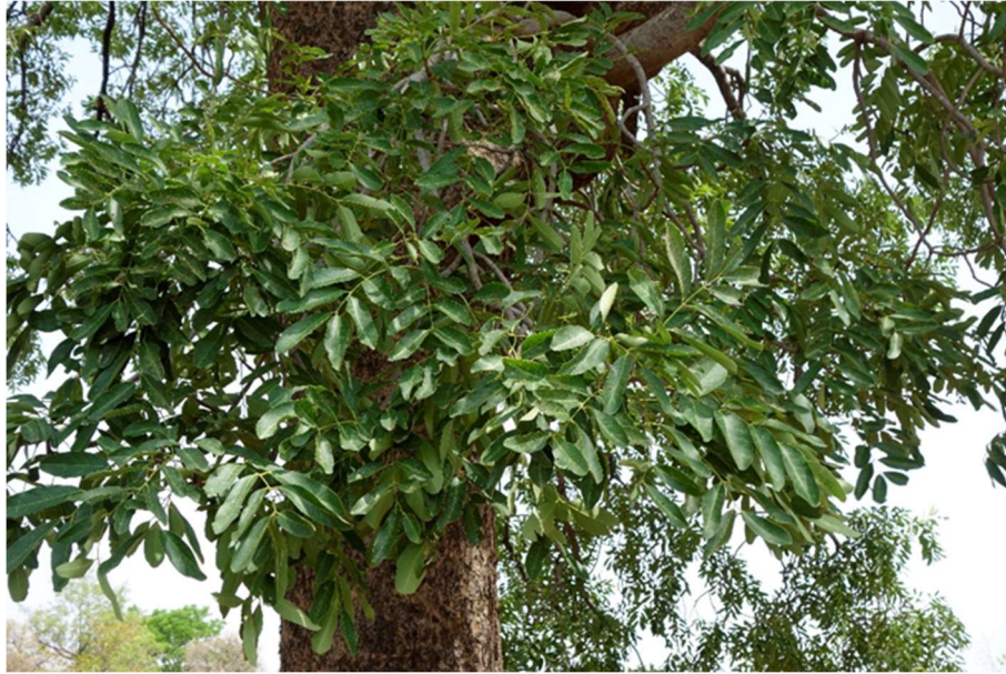
Figure 8. Feuilles pennées de Khaya senegalensis ( péemu ) dans la commune de Bondoukuy