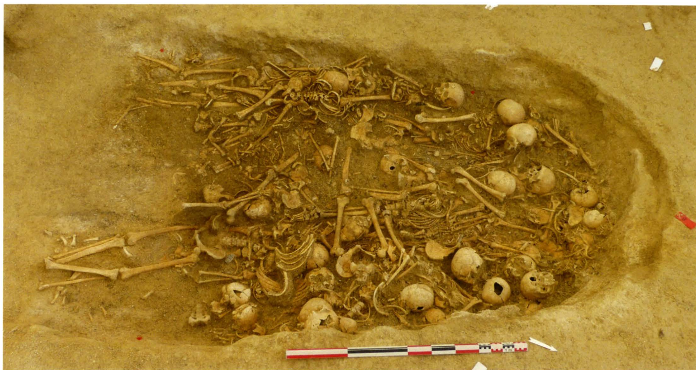
Figure 3 – Vue de la chambre funéraire après dégagement des ossements.