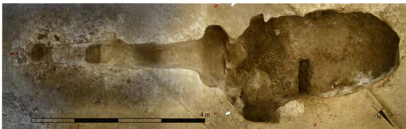
Figure 2 – Vue générale de l'hypogée avant la fouille de la couche d'inhumations.

Spatialement, les hypogées du secteur de Châlons-en-Champagne semblent constituer un groupe qui était jusqu'à présent le plus mal connu de tous. Leur datation est tout à fait comparable à celle des autres sépultures collectives du département. Les types d'objets sont globalement comparables, même si des variations semblent pouvoir être mises en évidence. Les hypogées de la région des Marais de Saint-Gond ou du secteur de La Côte des Blancs sont tous creusés dans la craie franche, ce qui les différencie nettement de ceux de Saint-Memmie ou de Châlons-en-Champagne pour lesquels la présence d'une voûte aménagée dans le substrat reste encore à démontrer. Les pratiques funéraires mises en évidence dans la sépulture de Saint-Memmie pourront être comparées à celles qui ont été étudiées dans les autres secteurs du département de la Marne, mais aussi dans les régions voisines (Blin 2011, 2012, 2015, 2018).