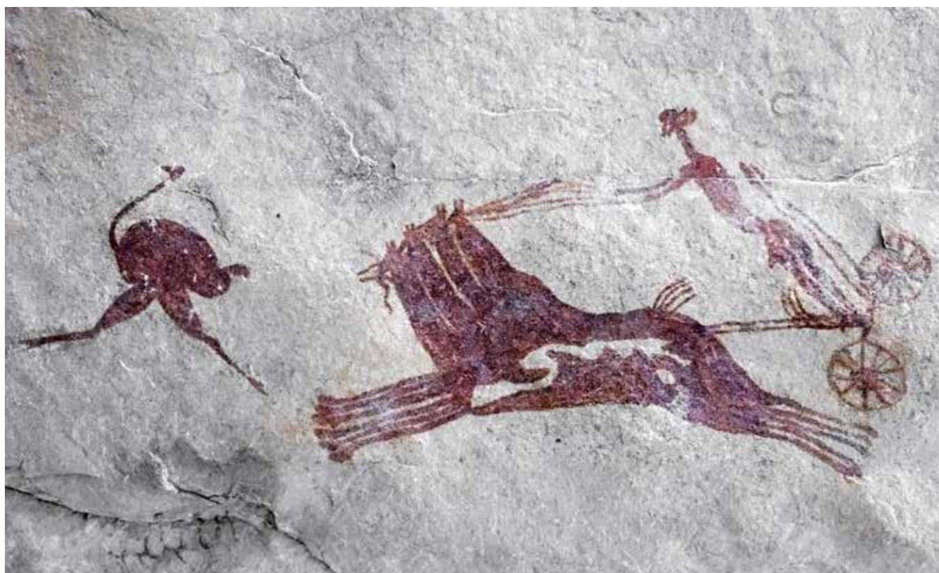
Quadriga au galop poursuivant une autruche, peint à Ano Mellen, Tasīli-n-Ājjjer (d'après Gauthier & Gauthier 2018 : fig. 37-38).

1. Selon lui, nous l'aurions accusé de plagiat : « tant ma thèse que mes articles possèdent des bibliographies mentionnant les travaux des auteurs que je suis sensé avoir plagiés [...] La citation se poursuit sans rien apporter à l'accusation de plagiat qui m'est faite. » Cette accusation est parfaitement infondée. Nous avons parlé d'absence de citation et jamais de plagiat ; c'est Dupuy qui extrapole avec la même tendance à l'exagération que dans le reste de sa réponse, en cherchant vainement à démontrer ce qu'il pense être l'ignominie de ce qu'il imagine être une attaque. Le moins qu'on puisse dire est que sa crédibilité n'en sort pas grandie.