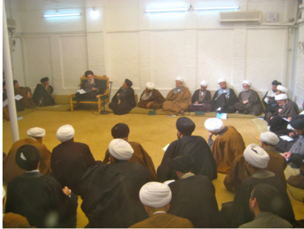
© cliché Gérard-François Dumont - mars 2011.