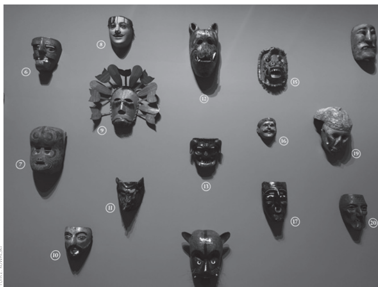
Vido al la ekspozicio, muro de maskoj.

Dividita laŭ regionaj sekcioj, la ekspozicio prezentas la specifecon de la unuopaj lingvo-fami-