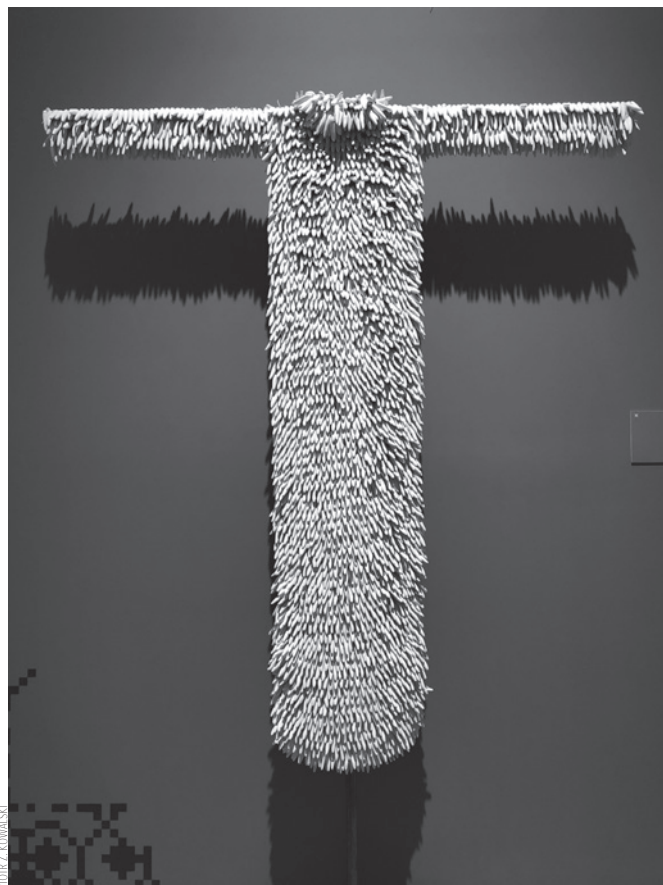
Xawery Wolski, Sen titolo , 2017.

La ekspozicio komenciĝas per la frua koloniisma periodo, kiam kleraj misiistoj ekinteresiĝis pri la lingvoj, transskribis ilin al la latina alfabeto, ektradukis kaj klopodis redakti priskribojn, gramatikojn kaj vortarojn. Sed tiu enkonduka sekcio ankaŭ montras la valoron de la lingvo kiel posedaĵo de teritorio. Atestas tion la kodekso "Historio de Txacala ", finredaktita en 1585, en la hispana kaj naŭatla, el kiuj unu kopio estis sendita al la hispana reĝo. Pere de riĉa sistemo de ilustraĵoj kaj priskriboj ĝi ilustras la kulturen kaj politikan evoluon de la popoloj en la regiono ĉirkaŭ Meksikurbo post la alveno de la Hispanoj. Ankaŭ la podologiaj mapoj de Cuauhtinchan (kopiitaj ĉirkaŭ 1900 de José Maria Velasco ) montras, kiom la spacorilato de specifa homgrupo influas la lingvostrukturon.