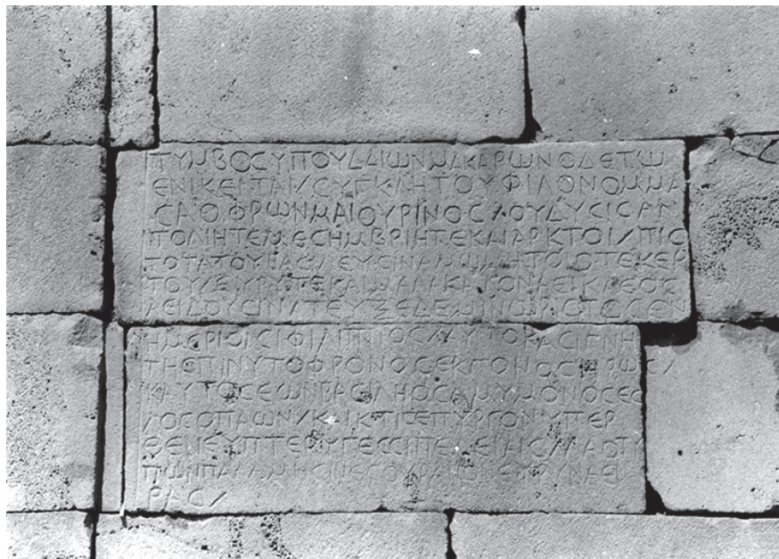
Figure 2. Épigramme funéraire grecque pour Maiorinus à Buṣr al-Ḥarīri, IGLS 15, 241.

« Ce tombeau appartient aux bienheureux qui séjournent sous la terre. Dans celui-ci repose le sage Maiorinus, figure chérie du Sénat, dont le Couchant, le Levant, le Midi et les Ourses ... chantent à jamais la vaste et magnifique gloire. Le meilleur des mortels Philippe l'a bâti, héros descendant de sa sœur avisée et lui-même noble compagnon d'un empereur sans reproche ; il a aussi fondé au-dessus une tour pour les pigeons aux ailes rapides, l'ayant élevée grâce aux mains des tailleurs de pierres jusqu'au vaste ciel. »