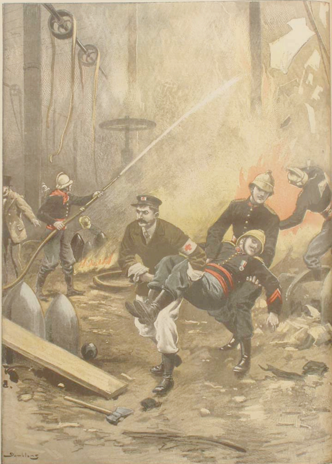
Incendie d'usine à Saint-Denis