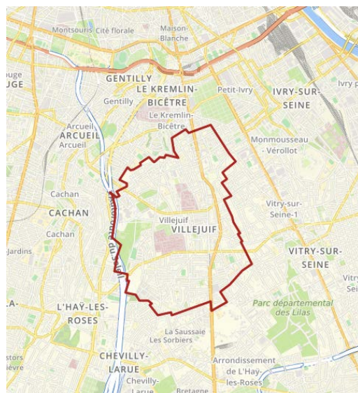
FIGURE 1. SITUATION TERRITORIALE DE LA VILLE DE VILLEJUIF