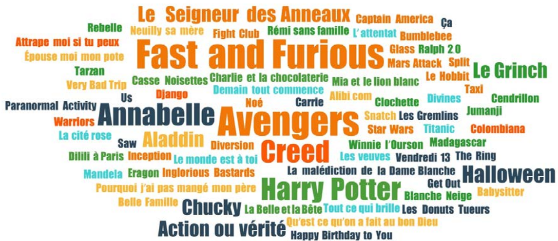
FIGURE 3. TITRES DE FILMS CITÉS PAR LES ADOLESCENT·E·S DE BOURGOIN-JALLIEU EN ENTRETIEN

La taille des titres reflète la fréquence de citation en entretien : Avengers est cité 3 fois ; Paranoïa , Love , Simon , Taxi 5 , 50 nuances de Grey , Annabelle et Conjuring sont cités 2 fois. Les films d'une même franchise ont été réunis ( Avengers 2 et Avengers 3 ; Conjuring 1 et Conjuring 2 ).