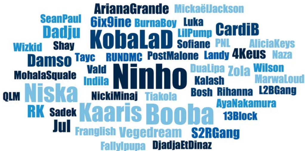
FIGURE 2. ARTISTES CITÉS PAR LES ADOLESCENT-E-S DE VILLEJUIF PENDANT LES ENTRETIENS

La taille du nom des artistes reflète la fréquence de citation en entretien : la plupart ont été cités une fois ; Ninho est cité 9 fois ; Booba 7 fois ; Koba La D, Niska et Kaarie 6 fois ; Dadju, Damso, RK, Jul et Cardi B 3 fois, etc.