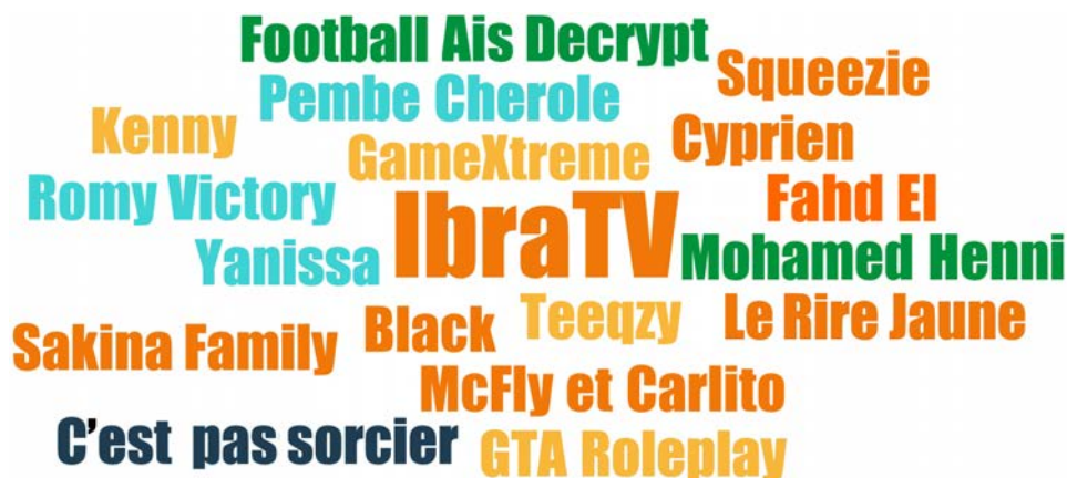
FIGURE 6. CHAINES YOUTUBE REGARDÉES PAR LES ADOLESCENT·E·S DE VILLEJUIF

La taille des titres reflète la fréquence de citation en entretien : tous les youtubeurs et youtubeuses ont été cités une fois à l'exception d'IbraTV, cité 2 fois.