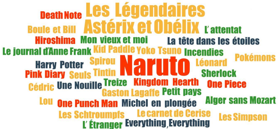
FIGURE 2. TITRES D'OUVRAGES CITÉS PAR LES ADOLESCENT·E·S DE BOURGOIN-JALLIEU PENDANT LES ENTRETIENS

La taille des titres reflète la fréquence de citation en entretien : la plupart ont été cités une fois ; Naruto est cité 3 fois ; Les Légendaires et Astérix et Obélix 2 fois.