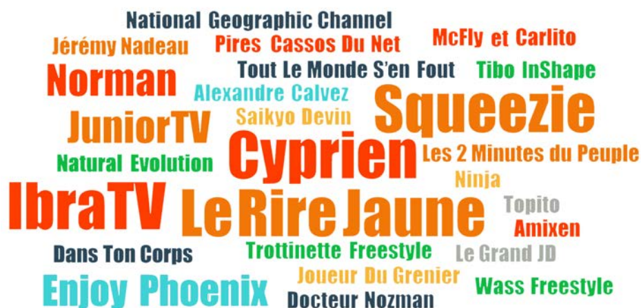
FIGURE 4. CHAINES YOUTUBE REGARDÉES PAR LES ADOLESCENT·E·S DE DAMMARIÉ-LES-LYS

La taille des titres reflète la fréquence de citation en entretien : la plupart ont été cités une fois ; Cyprien, Le Rire Jaune, Squeeze et Ibra TV sont cités 3 fois ; Junior TV, Norman et Enjoy Pheonix 2 fois.