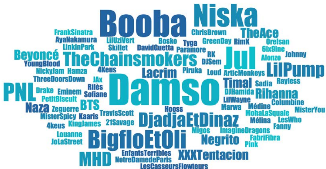
FIGURE 1. ARTISTES CITÉS PAR LES ADOLESCENT·E·S PENDANT LES ENTRETIENS

La taille du nom des artistes reflète la fréquence de citation en entretien : la plupart ont été cités une fois ; Damso est cité 9 fois ; Booba 8 fois ; Jul et Niska 6 fois ; PNL, Big Flo & Oli et MHD 4 fois ; Negrito, The Chainsmokers, Djadja & Dinaz et Lil Pump 3 fois, etc.