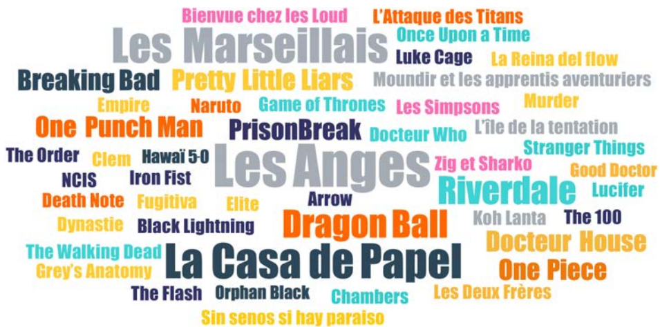
FIGURE 5. TITRES DE SÉRIES CITÉS PAR LES ADOLESCENT·E·S DE VILLEJUIF EN ENTRETIEN

La taille des titres reflète la fréquence de citation en entretien : Les Anges est citée 5 fois ; La Casa de Papel et Les Marseillais 4 fois ; Riverdale et Dragon Ball 3 fois ; Docteur House , Breaking Bad , One Punch Man , Pretty Little Liars , One Piece et Prison Break 2 fois.