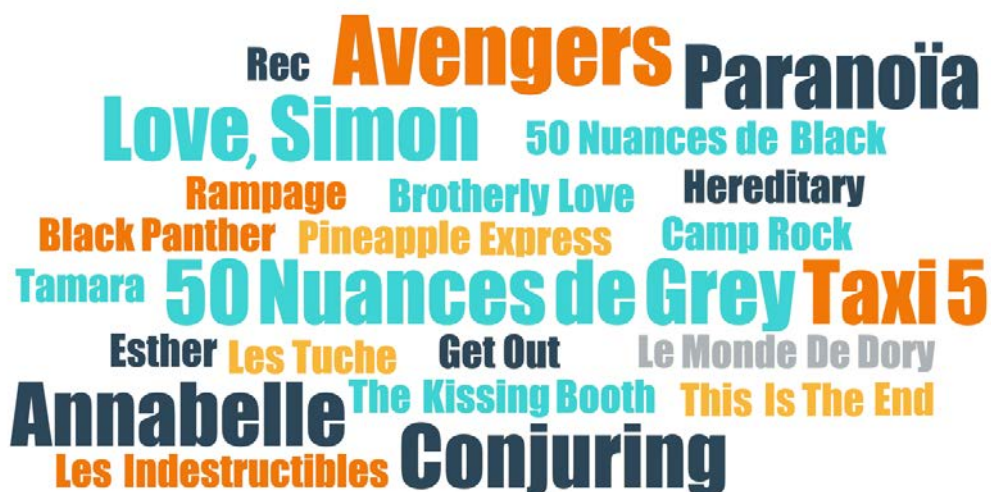
FIGURE 5. TITRES DE FILMS CITÉS PAR LES ADOLESCENT·E·S EN ENTRETIEN

La taille des titres reflète la fréquence de citation en entretien : Avengers est cité 3 fois ; Paranoïa , Love, Simon , Taxi 5 , 50 nuances de Grey , Annabelle et Conjuring sont cités 2 fois. Les films d'une même franchise ont été réunis ( Avengers 2 et Avengers 3 ; Conjuring et Conjuring 2 ).