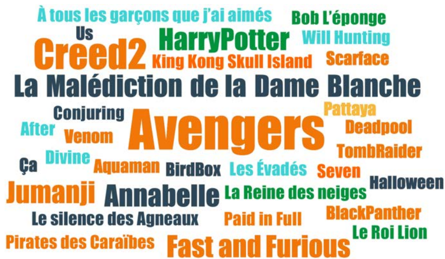
FIGURE 4. TITRES DE FILMS CITÉS PAR LES ADOLESCENT·E·S DE VILLEJUIF EN ENTRETIEN

La taille des titres reflète la fréquence de citation en entretien : la plupart des titres sont cités une fois ; Avengers est cité 5 fois ; Creed 2 3 fois ; Fast and Furious , Harry Potter , La Malédiction de la Dame Blanche , Jumanji et Annabelle 2 fois.