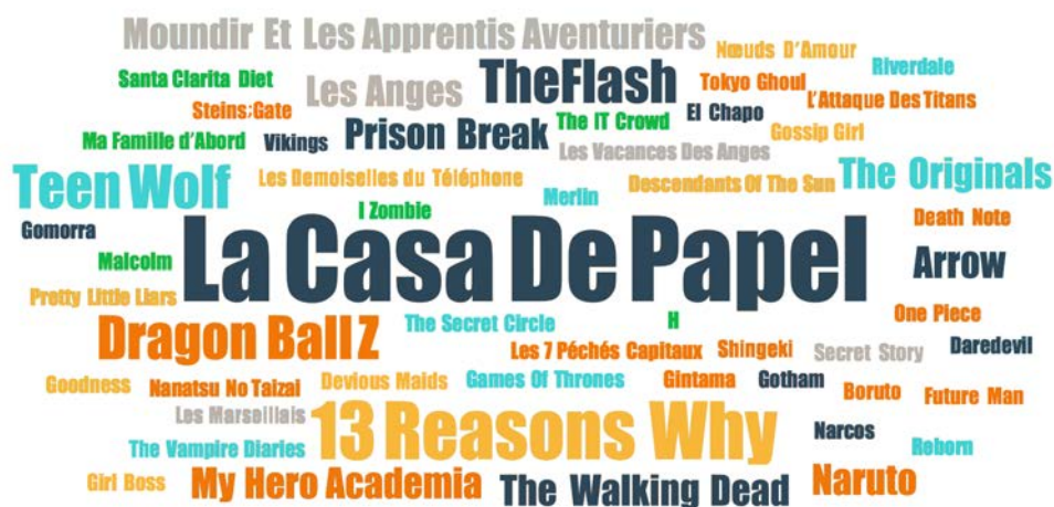
FIGURE 3. TITRES DE SÉRIES CITÉS PAR LES ADOLESCENT·E·S EN ENTRETIEN