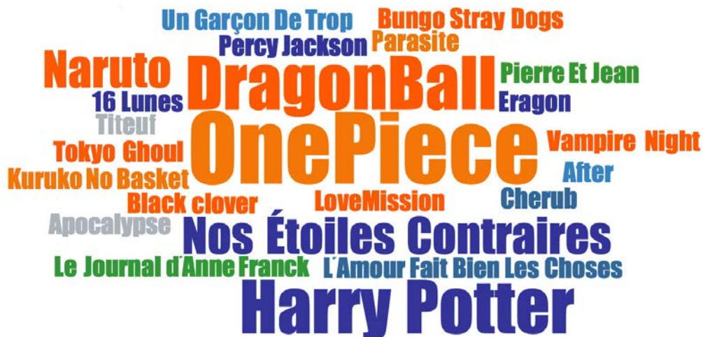
FIGURE 2. TITRES D'OUVRAGES CITÉS PAR LES ADOLESCENT·E·S PENDANT LES ENTRETIENS

La taille des titres reflète la fréquence de citation en entretien : la plupart ont été cités une fois ; One Piece est cité 4 fois ; Dragon Ball et Harry Potter 3 fois ; Naruto et Nos Étoiles contraires 2 fois.