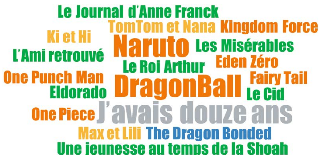
FIGURE 3. TITRES D'OUVRAGES CITÉS PAR LES ADOLESCENT·E·S DE VILLEJUIF PENDANT LES ENTRETIENS

La taille des titres reflète la fréquence de citation en entretien : la plupart ont été cités une fois ; J'avais douze ans , Naruto et Dragon Ball ont été cités 2 fois.