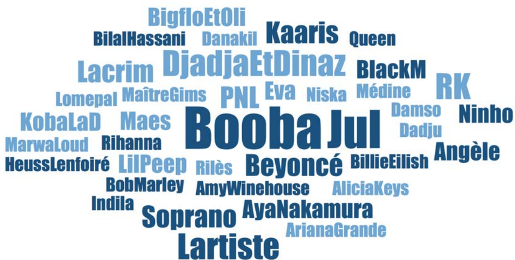
FIGURE 1. ARTISTES CITÉS PAR LES ADOLESCENT-E-S DE BOURGOÏN-JALLIEU PENDANT LES ENTRETIENS

La taille du nom des artistes reflète la fréquence de citation en entretien : la plupart ont été cités une fois ; Booba est cité 9 fois ; Jul 8 fois ; L'artiste, Djadja & Dinaz et RK 5 fois, etc.