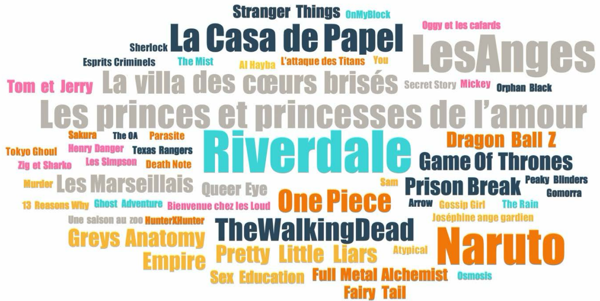
FIGURE 4. TITRES DE SÉRIES CITÉS PAR LES ADOLESCENT·E·S DE BOURGOIN-JALLIEU EN ENTRETIEN

La taille des titres reflète la fréquence de citation en entretien : Riverdale est citée 8 fois ; Les Anges et Naruto 7 fois ; Les princes et princesses de l'amour 6 fois ; La Casa de Papel 5 fois ; La villa des cœurs brisés , The Walking Dead et One Piece 4 fois ; Les Marseillais , Game of Thrones et Prison Break 3 fois, etc.