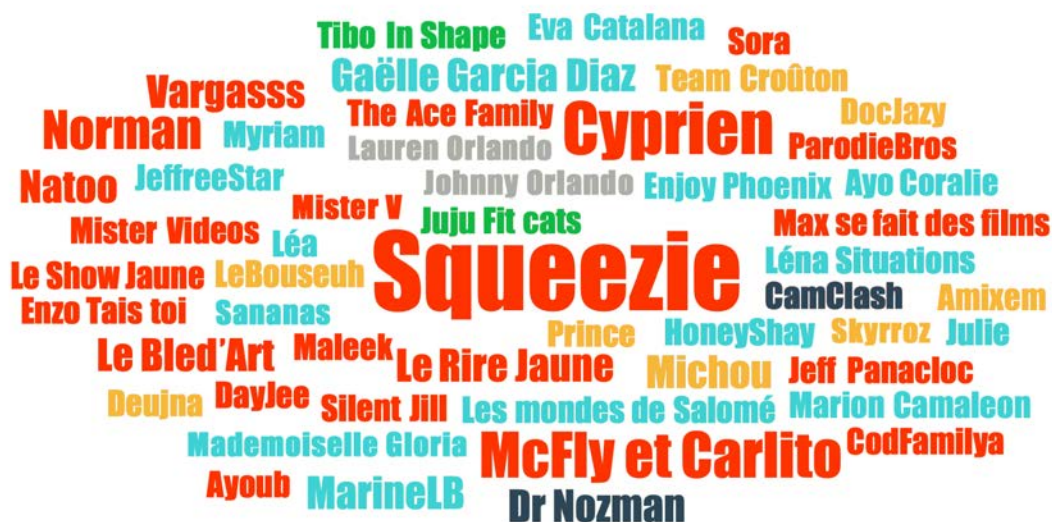
FIGURE 5. CHAINES ET VIDEASTES CITES PAR LES ADOLESCENT·E·S DE BOURGOIN-JALLIEU EN ENTRETIEN