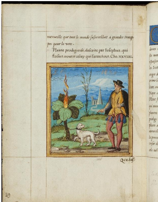
Figure 6. Pierre Boaistuau, Histoires prodigieuses , [1559]. Londres, Wellcome Library, ms. 136, f. 138v.