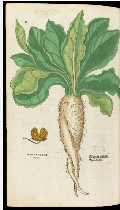
Figure 7. Leonhart Fuchs, De historia stirpium commentarii insignes , Bâle, Isingrin, 1542. Gallica (BnF).

Fig. 4.2. Morelle, Solanum , Leonhart Fuchs, Commentaires tres excellens de l'hystoire des plantes , chez Jacques Gazeau [...], 1549 (Université de Gand)