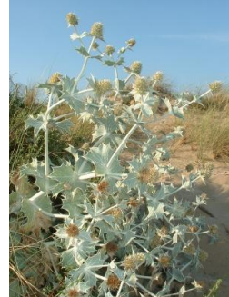
Figure 3. Panicaut ( Eryngium bourgatii ), et panicaut maritime ( Sea holly ), Wikicommons.