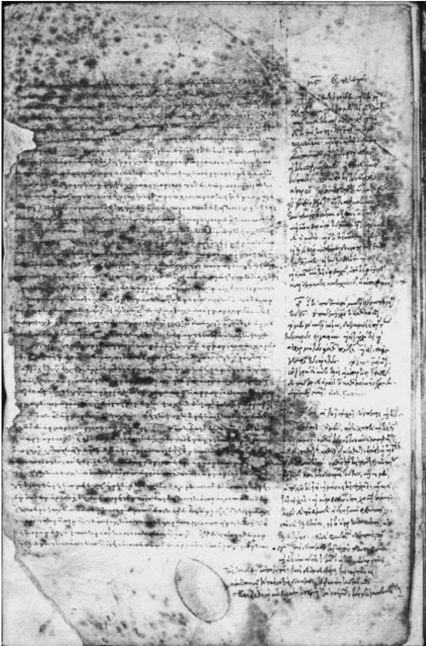
Cambridge (MA), Harvard University, Houghton Library, Typ. 46, f. 48v