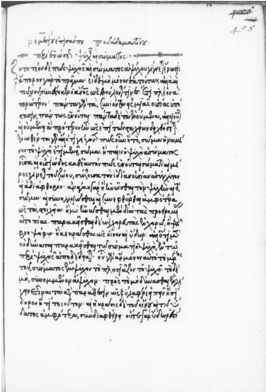
Wien, Österreichische Nationalbibliothek, Phil. gr. 110, f. 458r