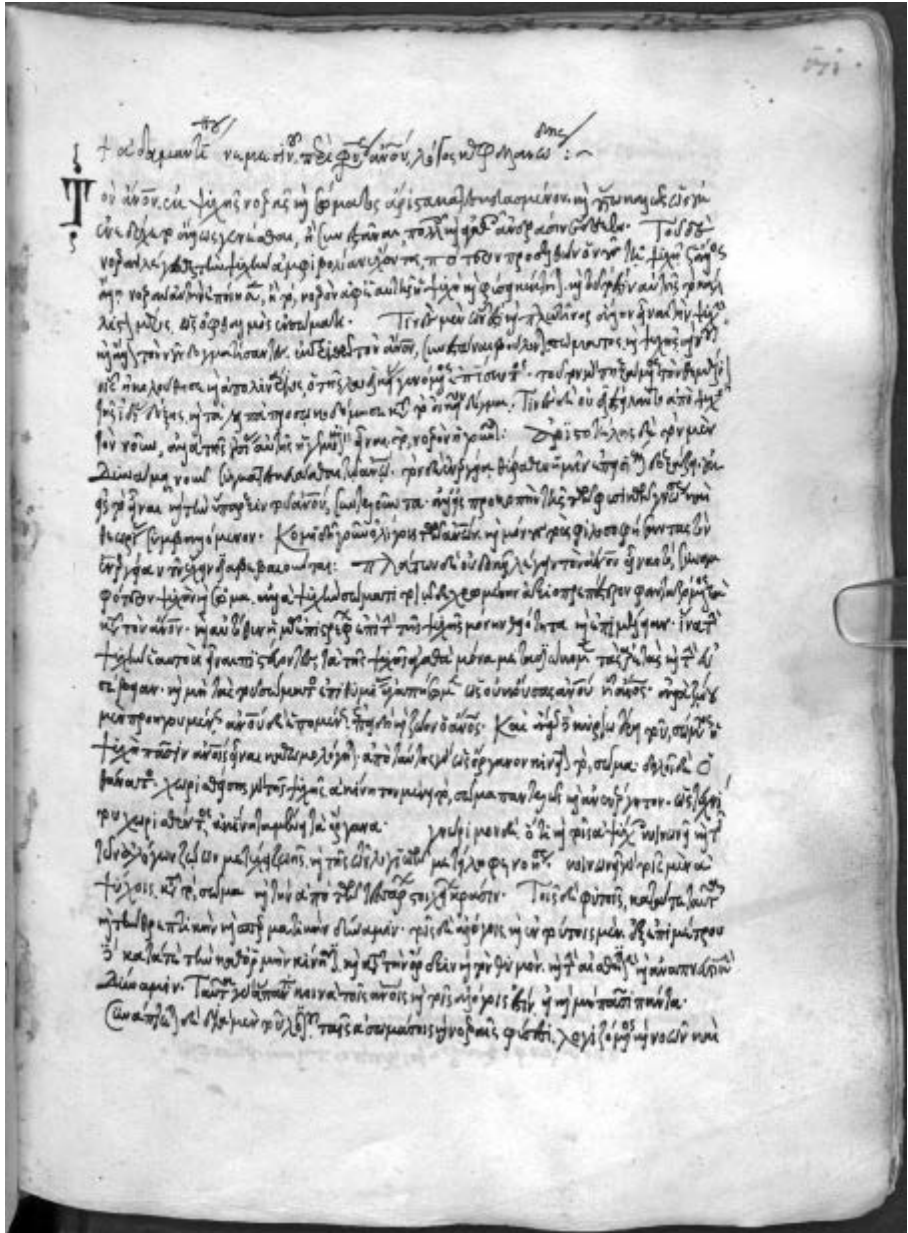
Wien, Österreichische Nationalbibliothek, Phil. gr. 181, f. 171r