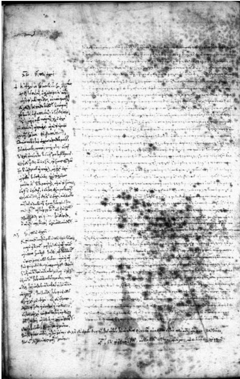
Cambridge (MA), Harvard University, Houghton Library, Typ. 46, f. 46v