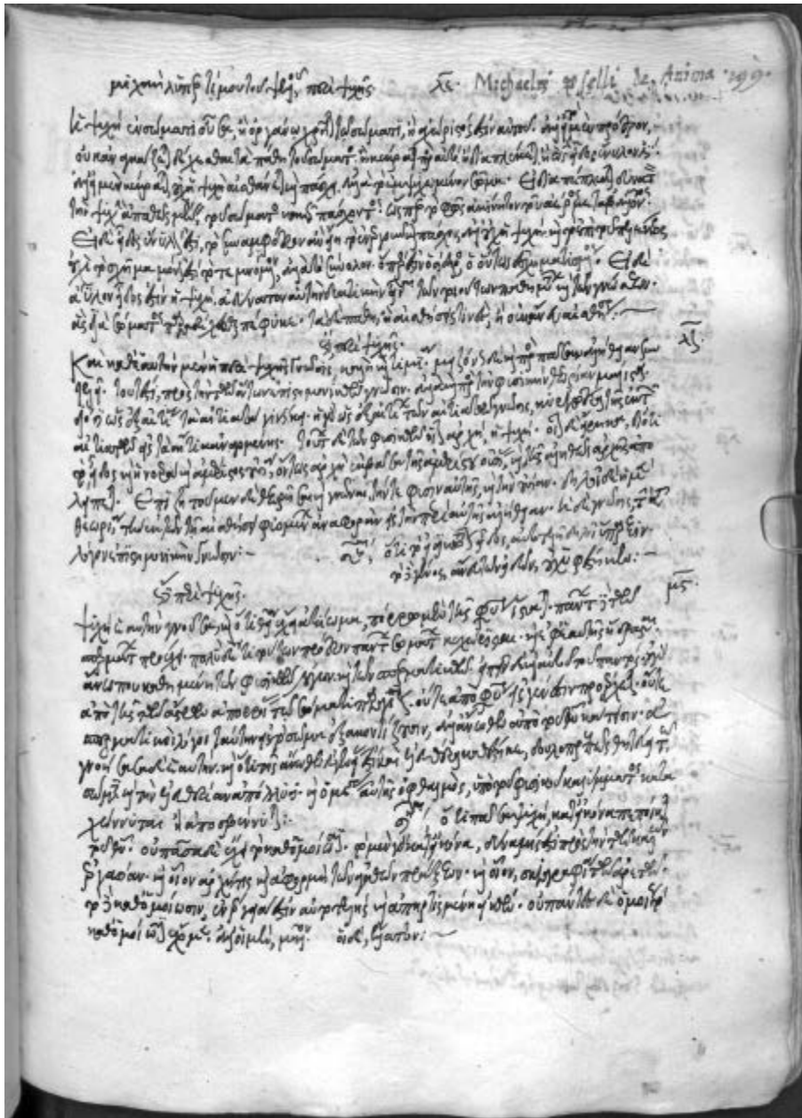
Wien, Österreichische Nationalbibliothek, Phil. gr. 181, f. 199r