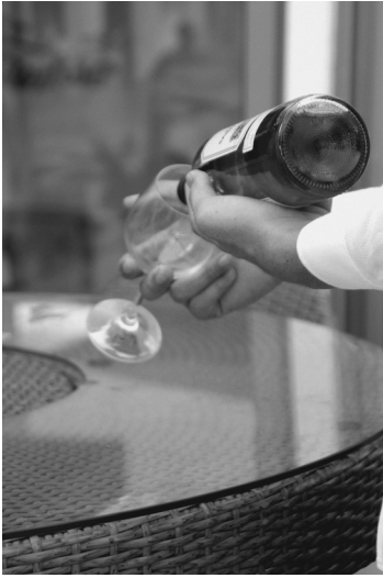
Figure 6. Servir le vin