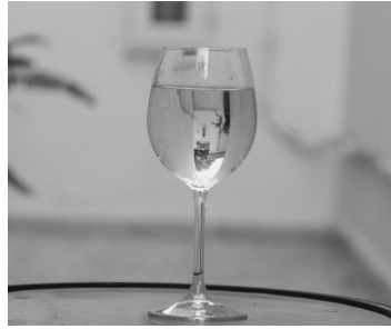
Figure 7. Verre de vin

Parfois, c'est l'association avec des adverbiaux annonçant un procès accompli ou des modalisateurs aspectuels qui permet de rendre compte de l'aspect en question ; on trouve cela dans les contextes où plusieurs actions se suivent, ou dans la description des différentes étapes d'un processus (voir Blanche-Benveniste 1988), comme le montre l'exemple suivant des ESLO :