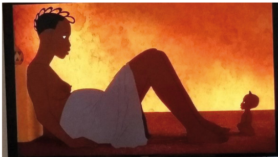
Figure 3. Kirikou avec sa maman (Michel Ocelot, Kirikou et la sorcière )