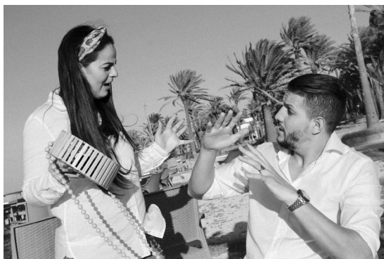
Figure 1. Couple en conflit 9