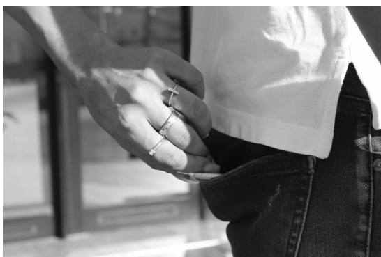
Figure 2. Pickpocket

Ce parallélisme entre le fait de prendre en charge l'action illustrée ou le fait de la subir est de nature à mettre en évidence la notion de diathèse; en l'occurrence, on aurait juste la légende d'une image et on pourrait demander aux apprenants d'imaginer un scénario ayant conduit à cette situation.