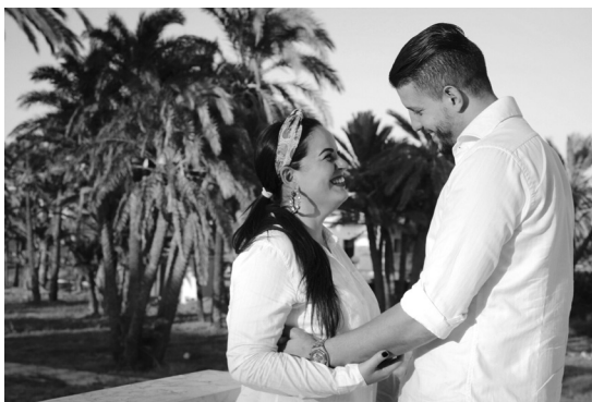
Figure 4. Couple amoureux