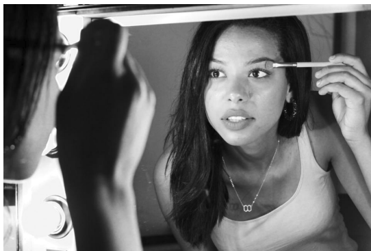
Figure 5. Dans la glace