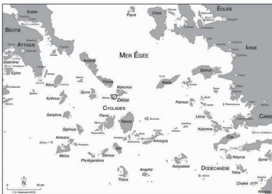
Fig. 1 - Les Cyclades 59