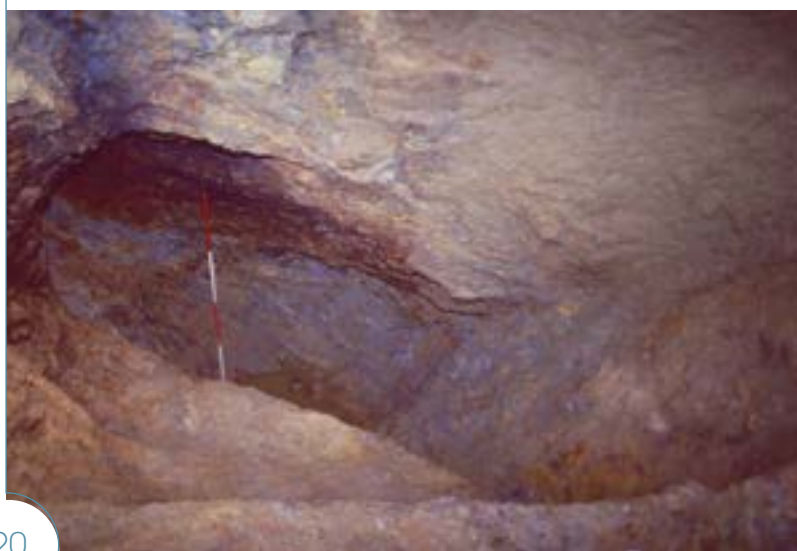
Chantier souterrain de type dépilage, exploité en gradins à la mine des Fouilloux (Jumilhac-le-Grand, Dordogne).

Les traces d'outils ou les formes arrondies et les marques de feu sur les parois rappellent la technique employée, qui est celle d'un abattage mixte, à l'outil en fer (pic, pointerolle et massette) dans les roches tendres (micaschistes et gneiss altérés de l'encaissant) et au feu dans les roches dures (gangue de quartz du minerai). Lors