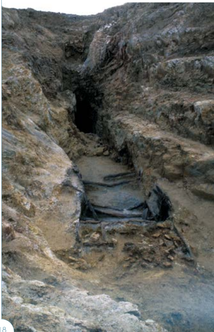
Mine d'or de la Fagassière (Château-Chervix, Haute-Vienne) en cours de fouille : exploitation de surface en gradins et début du dégagement du défilage souterrain avec boisages conservés en place.

La plus grande région aurifère de la Gaule indépendante se trouve sur le territoire des Lémovices, peuple gaulois qui occupait tout l'actuel Limousin, augmenté du nord-est de la Dordogne. Alors qu'aucune fouille n'avait été menée sur ces mines, appelées aurières, elles étaient considérées comme étant d'époque gallo-romaine. Mais leur étude devait révéler dès le milieu des années 1980 qu'elles avaient été exploitées à l'époque gauloise.