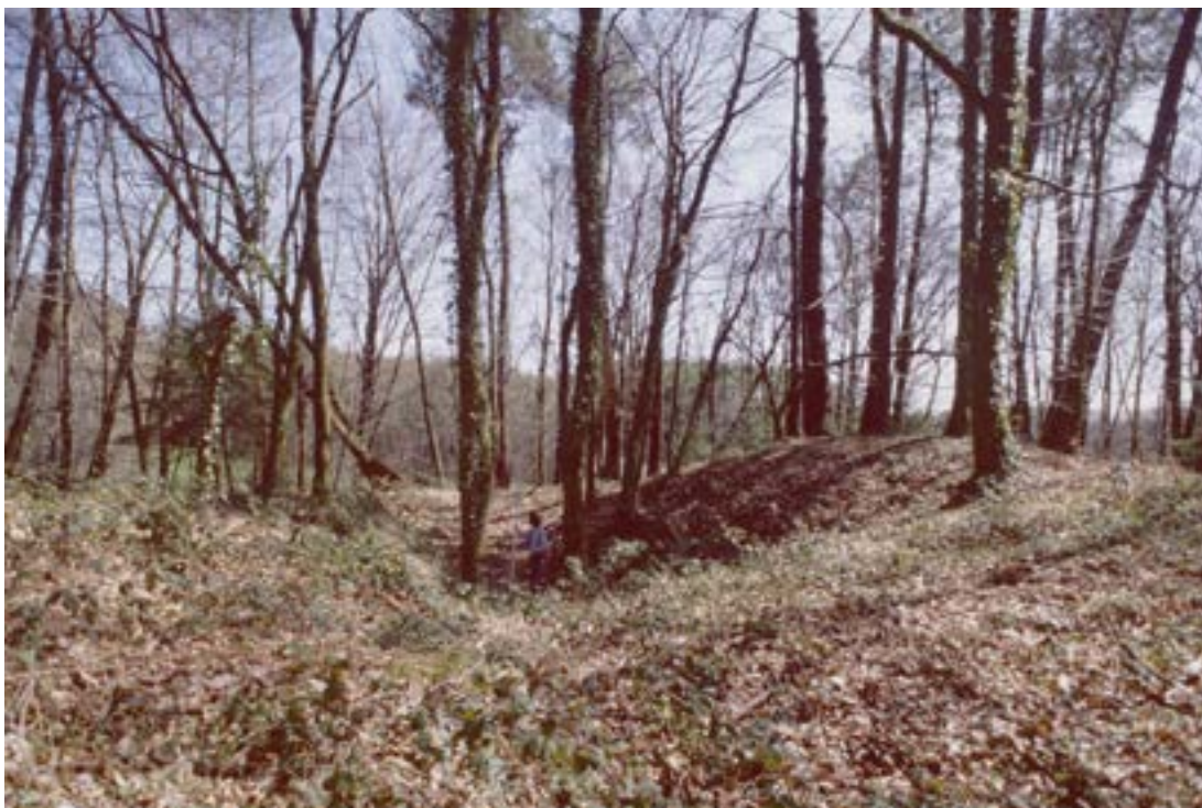
Petite aurière partiellement comblée au Puits de Mazet (Ambazac, Haute-Vienne).