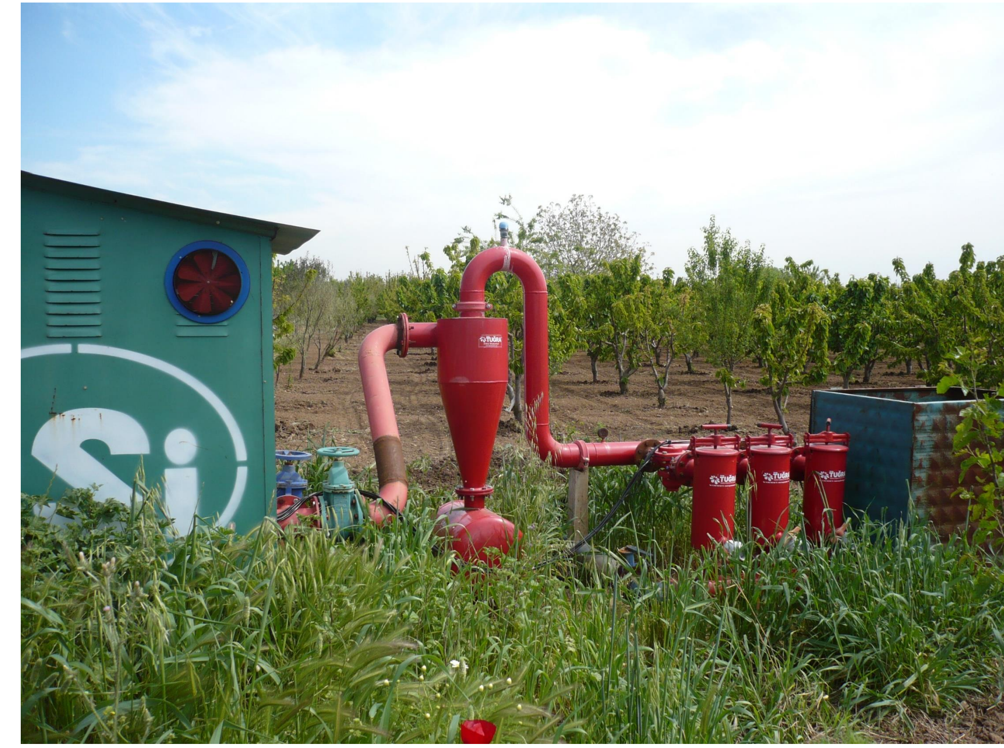
Légende : Forage d'une coopérative (premier plan) fournissant de l'eau à des parcelles de cerisiers irriguées en goutte-à-goutte (arrière-plan) via un système de distribution enterré à vannes.

Dès 1950, l'Etat turc investit massivement pour la constitution de grands périmètres irrigués, dont la gestion est transférée à partir de 1990 à des associations d'irrigants. Il y a en parallèle une utilisation croissante de l'eau souterraine pour une intensification de l'agriculture, souvent de manière non contrôlée. En réalité, bien que peu étudiées, des coopératives d'irrigation émergent dès 1950-1960, précurseurs du transfert de gestion de l'irrigation sur de petites surfaces en Turquie. En 2011, il y en avait 2 497, avec 13 unions régionales et un total de 295 904 membres. 20% de l'irrigation du pays serait basée sur l'eau souterraine et officiellement, c'est 80% de celle-ci qui serait gérée par ces coopératives. Les périmètres qu'elles irriguent se limitent à l'échelle d'un village. Elles permettent d'appréhender à taille humaine les relations agriculteurs-coopératives-Etat, ainsi qu'une organisation collective autour de l'eau souterraine, alors que cette ressource est souvent perçue comme privative par les agriculteurs qui y accèdent individuellement.