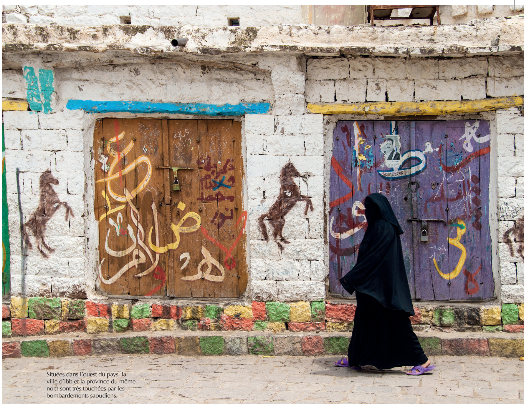
Situées dans l'ouest du pays, la ville d'Ibb et la province du même nom sont très touchées par les bombardements saoudiens.