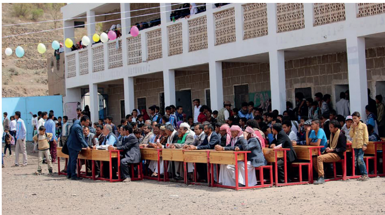
Réunion du conseil de village dans l'école d'Al-Sanahi (Badan), en 2018.