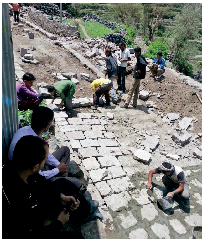
Pavage de piste à Dhikham (Badan) en 2017.

Dans ce contexte de grands changements politiques ayant provoqué une crise humanitaire sans précédent, dans lequel se greffe donc une administration locale défaillante, des initiatives communautaires sur la base du volontariat se sont multipliées au cours des dernières années au sein de la société rurale et plus particulièrement dans la région des hauts plateaux. Territoire essentiellement rural, à l'est de la ville d'Ibb et à environ 150 kilomètres au sud de Sanaa, le district de Badan est montagneux et dominé par les cultures en terrasses. Culminant à plus de 2 000 mètres, il regroupe 246 villages sur 240 kilomètres carrés et comptait en 2004 – date du dernier recensement national – 116 045 habitants, chiffre qui pourrait avoir augmenté de 50 %.