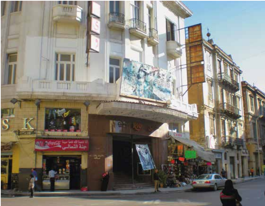
Cinéma Rialto, Alexandrie, 2008 : « L'Europe plus vraie que nature que l'on retrouve aux quatre coins du monde, dans des lieux privilégiés fondés par des nostalgiques qui ont tout mis ensemble » (Rispoli & Depaule, 2010 : 36).

C'est aussi un espace social et humain, qualitativement hétérogène et ayant une valeur spécifique, tous deux situés dans une histoire désormais sans devenir (Jankélévitch 1974), qu'ils regrettent. C'est enfin la conscience d'une « disparition de son moi passé » (Lambony 2012 : 6).