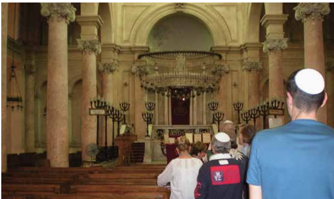
Visite à la synagogue Eliahou Hanavi, Alexandrie, 2010 : « Si tu n'as pas entendu leurs sanglots devenir prières et leurs prières chants d'outre-mémoire ; renonce, il vaut mieux, à parler de solitude » (Jabès 1963 : 83).

de son ancrage « trois fois millénaire ». Il n'est pas une libération que l'on célèbre mais une perte que l'on pleure encore, ni la promesse d'un accomplissement collectif mais le constat irréversible d'une part désormais manquante de soi.