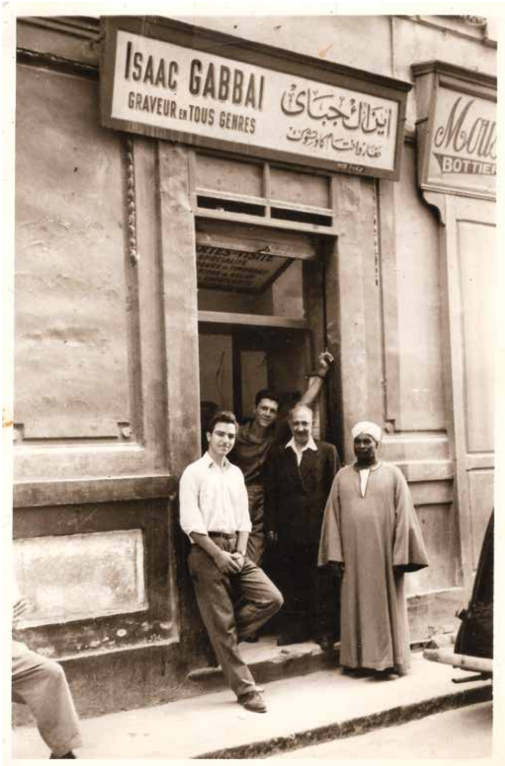
Alexandrie. Un artisan graveur avec deux apprentis et le gardien des boutiques de la rue, 1954.