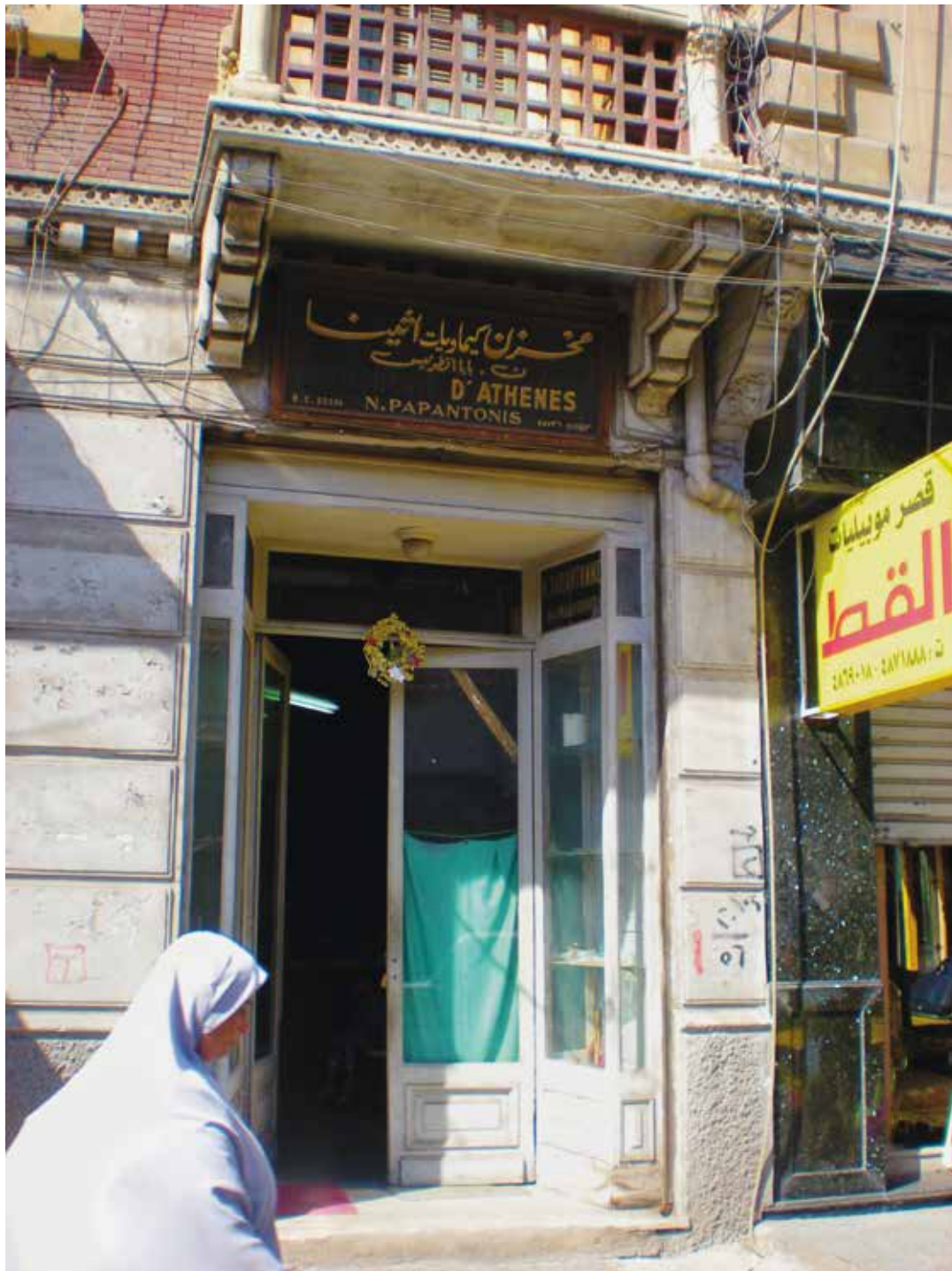
Alexandrie, 2010 : « Ma hâra a disparu. Elle est devenue coin de rue. Je l'ai parcourue sans reconnaître personne et personne ne m'a reconnu. [...] Le hiatus de mon enfance a disparu. Plus de fracture, plus de différence » (Rispoli & Depaule, 2010 : 36).