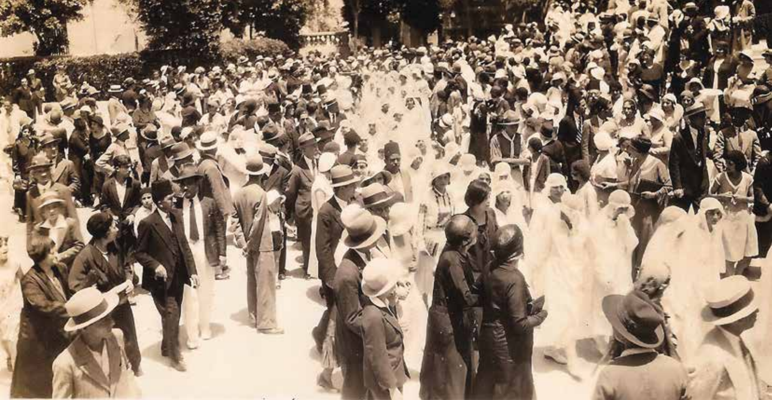
Communiantes dans les jardins de la grande synagogue d'Alexandrie : «Aucune parole pourtant ne détient à elle seule le secret privilégié de ces images muettes. Chacune est un miracle, chargé d'espace condensé, un raccourci sommaire de voyages aléatoires. Quel sort a voulu qu'elle échappe, au-delà des corps, au désastre ? » (Cabasso, in Hassoun et al. 1984 : 261), 1932.

regardé comme une matière première, pour se projeter et mettre en œuvre des projets collectifs. Cette nostalgie est une construction sociale du regret, qui n'est pas un désir de retour en arrière ni le signal d'un refus du présent, mais « un regard sur le chemin parcouru, une manière de dire que ce chemin n'a pas été solitaire, que nous l'avons fait ensemble » (Rautenberg 2003 : 19).