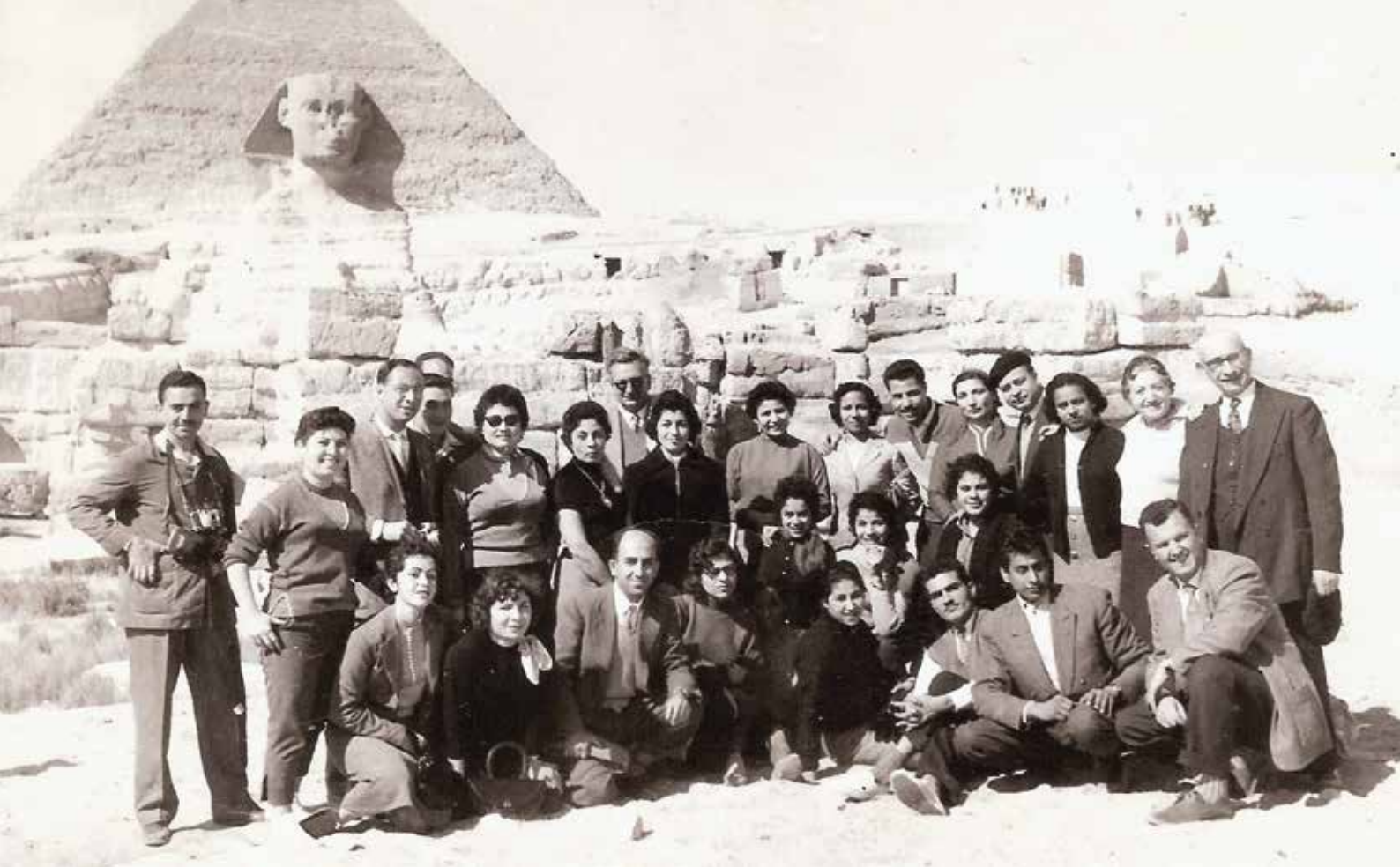
Un groupe d'employés des grands magasins Hannaux en excursion aux pyramides, dans la superposition des histoires et des ancrages millénaires. Le Caire, 1951.

dès lors mis sur l'histoire longue des juifs en Égypte 34 , sur l'incorporation de l'Égypte dans une géographie sacrée de la tradition juive et sur une histoire contemporaine, s'étirant sur moins de deux siècles où, de terre d'immigration, l'Égypte devient une terre natale. Cohabitent de ce fait des références à l'ancestralité et au caractère récent de la présence des juifs en terre d'Égypte, à une inscription de tout temps – des temps « immémoriaux » – et dans un temps déterminé. Par-delà les strates multiples de la dispersion des juifs, cette terre constitue un ancrage et un passage, socle double autour duquel s'articule le maintien d'une conscience communautaire, entre deux Exodes : l'un mythe historique et objet de mémoire, célébré comme une alliance fondatrice ; l'autre remémoré comme une rupture douloureuse, où l'Égypte n'est plus espace mythique mais espace approprié