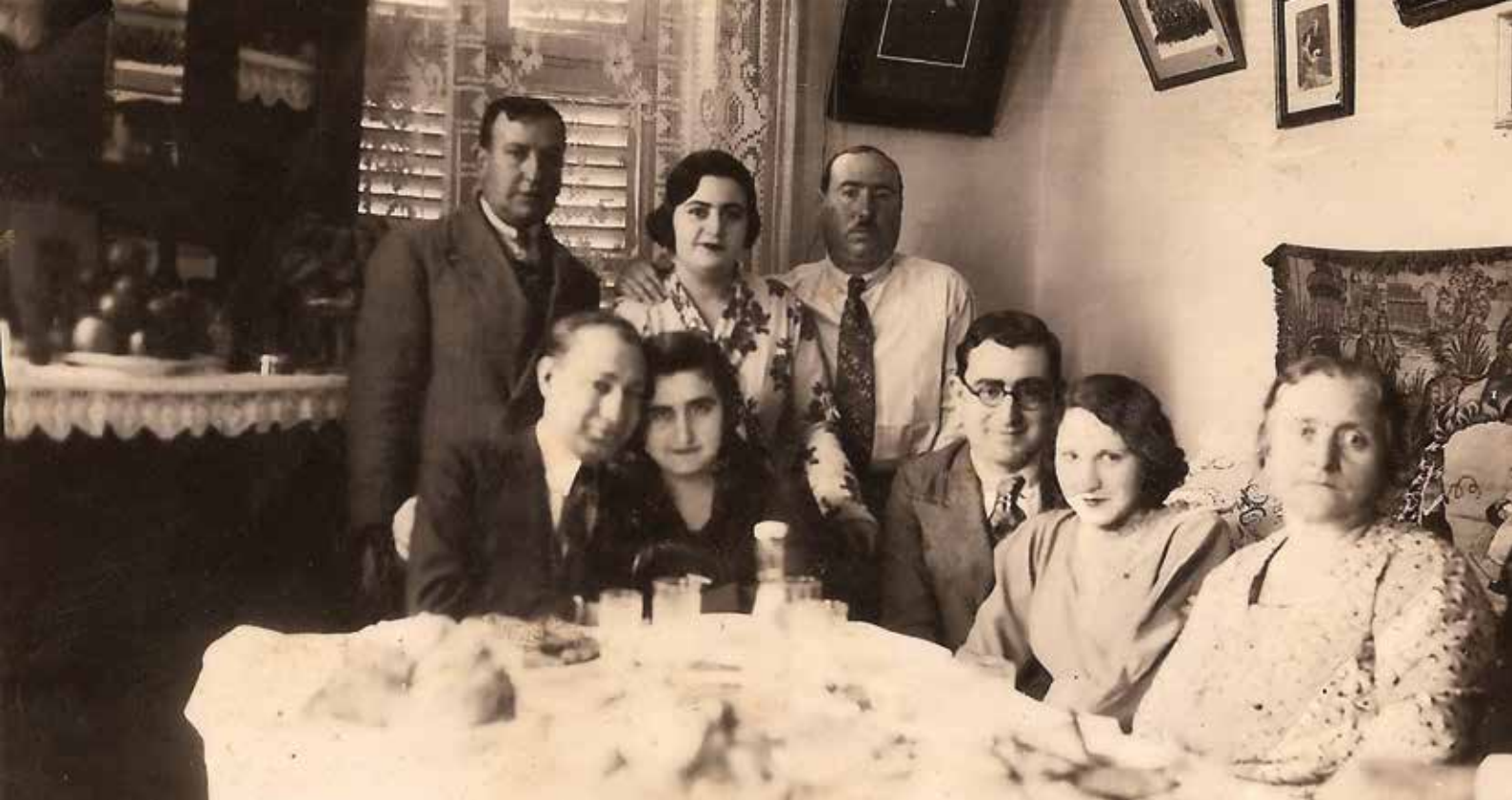
Fin d'un repas familial à Alexandrie, où la douceur de vivre « semble écarter toute menace », laissant les uns et les autres « au repos de toute l'histoire, quand bien même l'histoire s'apprête à les disperser, pour toujours une nouvelle fois » (Cabasso, in Hassoun et al. 1984 : 261), 1934. (coll.part.)

la mère qui voit son fils atteint de typhoïde et qui murmure, la main posée sur son front brûlant : « Môti ana, el walad 16 » (Oudiz 2007 : 13) ; à l'amour entre un homme et une femme ou à l'amour filial, s'exprimant par certaines incantations, telles que ba'adi 17 . C'est ainsi qu'Élie 18 , en exil en France, écrira un petit répertoire de vingt-quatre mots à destination de ses enfants, qui ne parlent pas l'arabe, dans lequel sept expressions sont des termes d'affection 19 , tels que basboussa (gâteau de semoule au sirop).