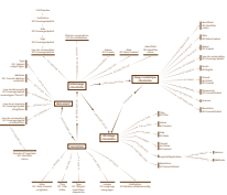
Fig. 2 p. 32

outils ou des formats de métadonnées, mais de les exprimer telles qu'elles existent, en définissant les différentes entités, leurs données sous-jacentes et leurs interdépendances qui, bien souvent, sont mélangées dans les bases de données d'estampages. C'est en partant des données préexistantes que nous avons pu construire ce modèle, moyennant une adaptation et une redistribution des informations présentes dans les bases de gestion d'estampages. Le résultat est donc un mapping autour de l'estampage qui prend en compte les cinq entités impliquées :