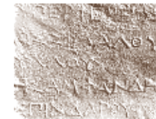
Fig. 1 p. 32

Depuis le début du XIX e siècle, l'épigraphie a recours à l'estampage afin de reproduire la surface inscrite d'une inscription gravée sur pierre. Transportable et maniable, l'estampage permet une étude à distance du texte gravé. Il est réalisé 4 avec un papier vergé sans colle, spécialement fabriqué pour cet usage, préalablement mouillé, puis frappé à l'aide d'une brosse à poils souples 5 . Cette technique est indispensable pour le moulage du relief en creux et la conservation de l'estampage sans risque de déchirure. Pour établir, rectifier ou compléter une édition d'un texte gravé, l'estampage constitue un premier instrument de travail, essentiel en raison de sa maniabilité qui se prête également aux variations de lumière sur la surface et