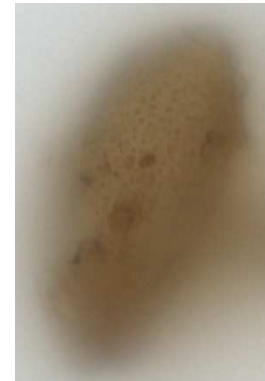
Figure 3 : Œuf de Capillaria forme hepatica vu en coupe à gauche et en surface à droite (52,85 x 27,71 \mu\text{m} ).