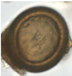
Figure 4 : Embryophore de Taenia/Echinococcus sp. (35,76 x 32,15 \mu\text{m} ).