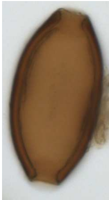
Figure 2 : Œuf de Trichuris forme trichiura (53,79 x 27,41 \mu\text{m} ).