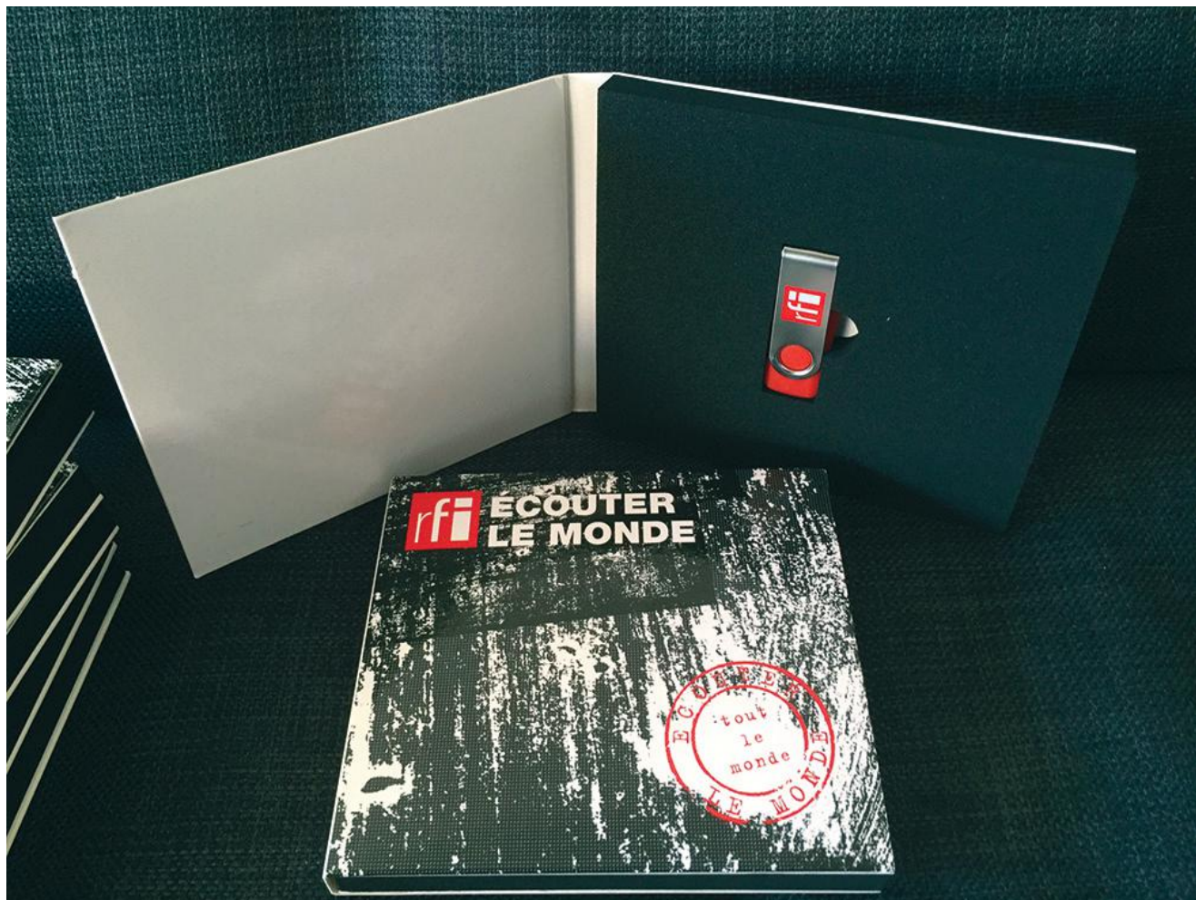
Coffret-audio Écouter le Monde (2019). Une collection de onze pièces sonores : 1 clé USB, 1 livret de présentation et crédits.