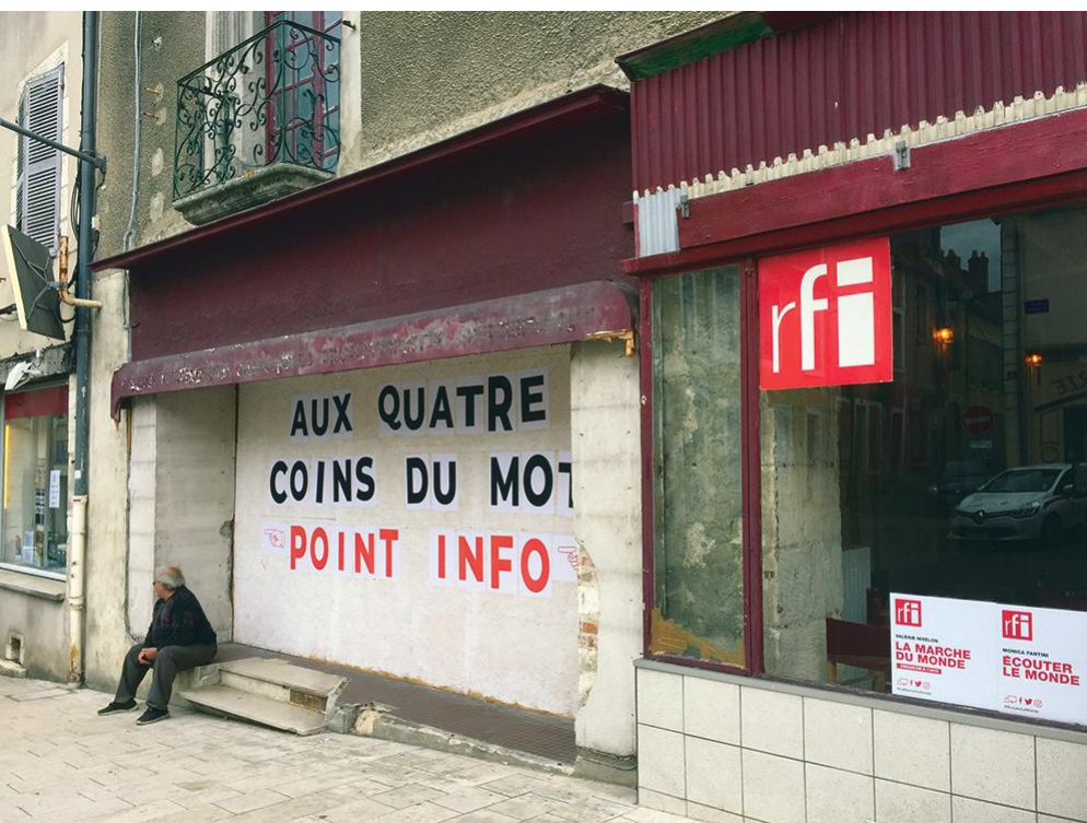
Salon d'écoute éphémère Écouter le Monde, Festival de La Charité sur Loire

Naturellement, le succès de cet événement nous invite à vouloir le reproduire dans d'autres contextes et, si possible, avec de nouveaux publics. Outre le fait de sensibiliser l'audience à l'écoute de l'environnement, cette expérience a permis de nous interroger sur la façon dont les sons collectés par les chercheuses et chercheurs en différents pays du monde font sens au moment de l'écoute in situ, « ici » (en France) et « maintenant » (dans le cadre d'une écoute partagée). Par ces différentes explorations, le projet Écouter le monde avec MILSON cherche à faire circuler les savoirs spécialisés des chercheurs et des artistes vers le grand public tout comme ceux des architectes et des designers qui se donnent pour mission de penser et concevoir notre environnement sonore quotidien.