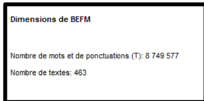
Figure 3. Dimensions de la version préliminaire de la BEFM (décembre 2020)

Créer un sous-corpus - textes : permet de constituer un corpus de travail contenant une partie des textes disponibles dans la BEFM. Le choix peut être fait à partir des métadonnées associées aux textes ou directement à partir des textes eux-mêmes (figures 4, 5 et annexe 2).