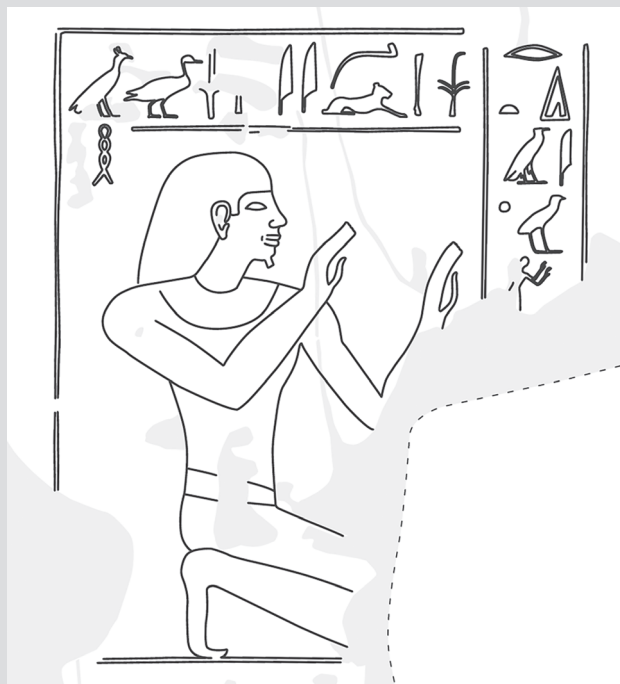
1. Représentation du vice-roi Nehy (fac-similé A. Guillou).