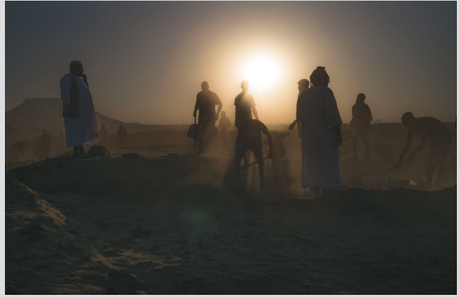
9. Ouvriers sur le chantier de fouille de la ville.