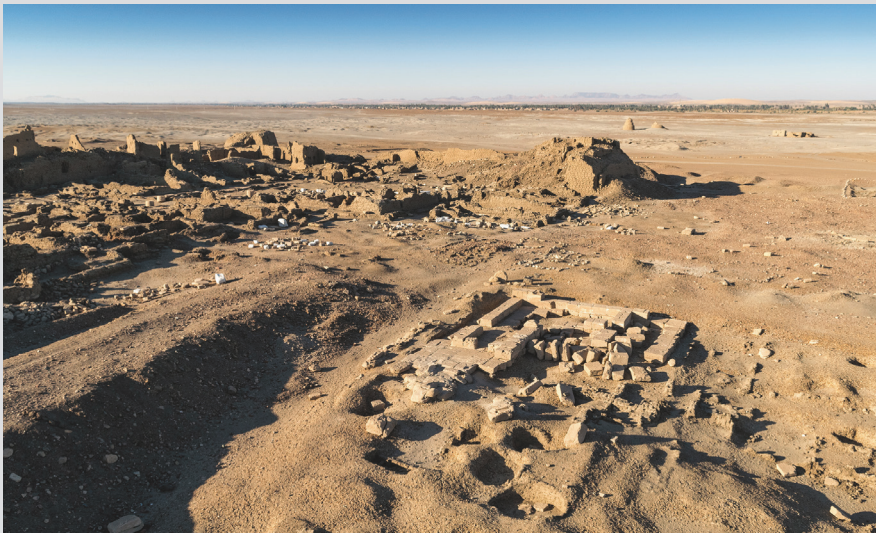
4. Ruines du temple d'Amon.