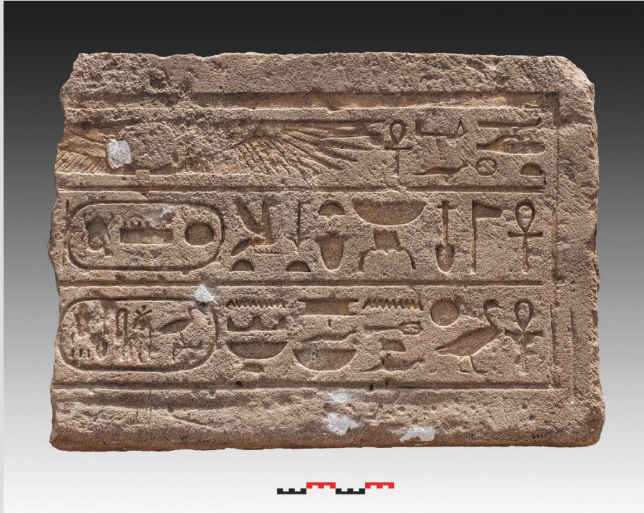
5. Linteau inscrit au nom de Thoutmosis III.