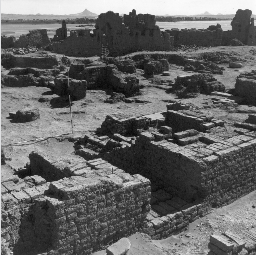
3. Anciennes fouilles sur la ville.