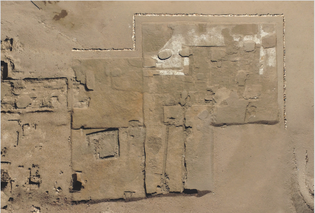
10. Angle Nord-Est de la fortification égyptienne.

de la section française de la direction des Antiquités du Soudan