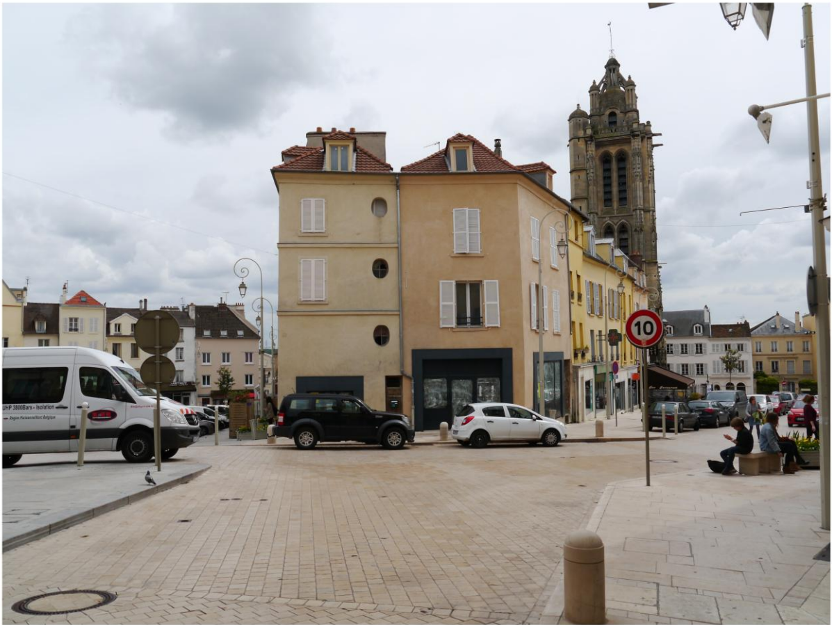
Fig. 3 : Pontoise : Lotissements des XVI e et XVIII e s. alignés sur le portail de l'église Saint - Maclou et séparant la place du cimetière en deux (photo Ehess - S. Robert, 2014).