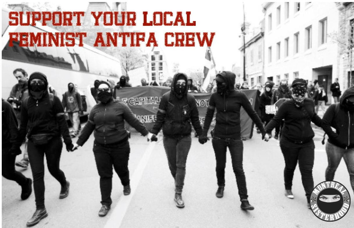
Image d'une première ligne tenue par des femmes black bloc le 1 er mai 2012.

égales aux hommes, dans un milieu où la prise de risque est particulièrement valorisée.