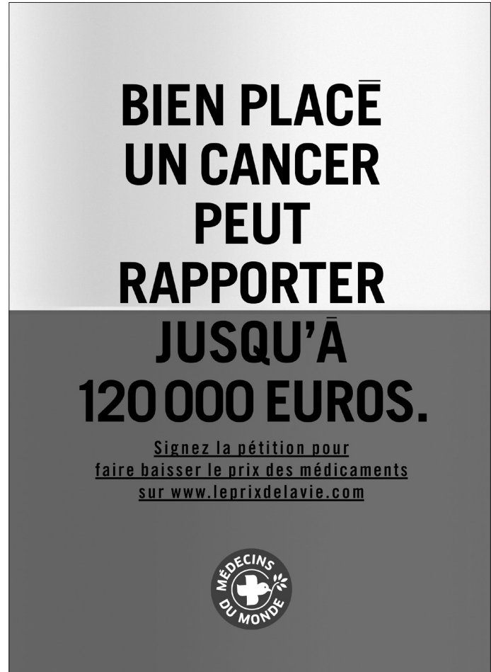
COUVERTURE DU RAPPORT « The Price of Sovaldi and its Impact on the US Health Care System » pour le comité des finances du Sénat américain, décembre 2015. AFFICHE DE MÉDECINS DU MONDE dans le cadre de la campagne « Le prix de la vie », 2016.