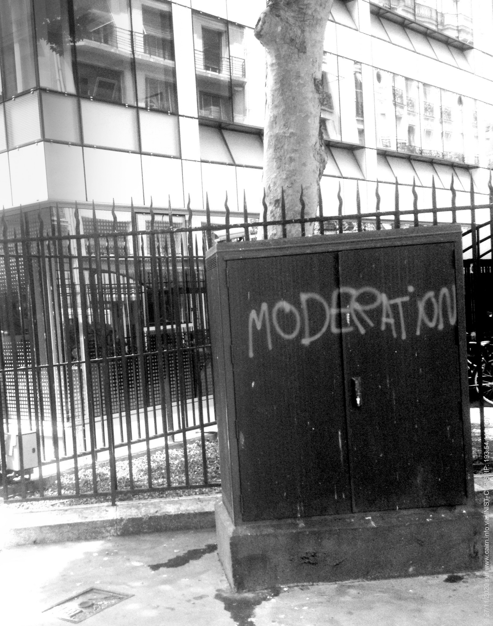
GRAFFITI PRÉSENT rue Alfred Dehodencq, attenante aux bâtiments de l'OCDE, à Paris 16 e .