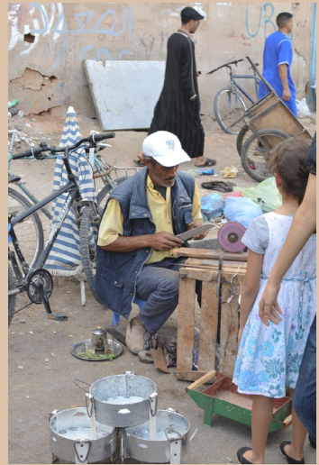
LE RÉMOULEUR DE COUTEAU INSTALLÉ DANS LA RUE.