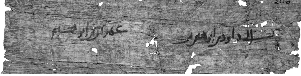
FIG. 2. — P. Cambr. UL Inv. Michael. A 1337 verso (détail)

« 1 Au nom de Dieu, le Clément, le Miséricordieux.