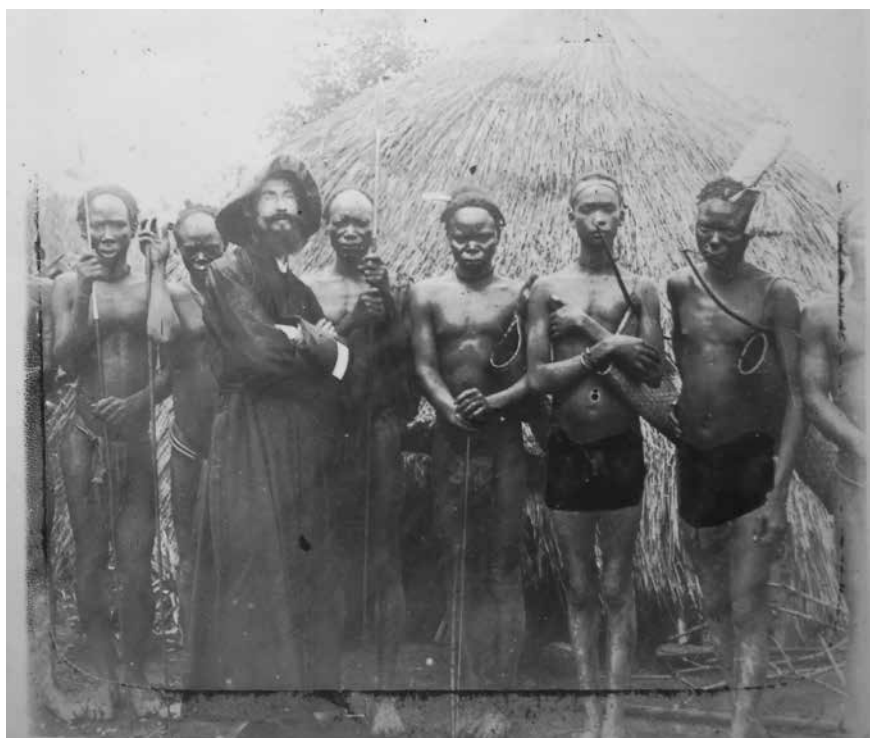
Fig. 2 – « Avec mes sauvages, 1909 »

habituels parmi le groupe togbo qu'il entreprend d'évangéliser. Des années plus tard, dans ses souvenirs manuscrits, il revient sur certaines anecdotes des premières années oubanguiennes : comme dans la rumeur concernant les religieux « voleurs d'enfants », on entrevoit alors, derrière l'apologie de l'évangélisation, certains enjeux de vie et de mort consubstantiels de l'entreprise missionnaire. Ce sont encore les « fétiches », la « sorcellerie », la « possession » qui esquissent l'arrière-fond conceptuel à travers lequel Daigre interprète ces événements lointains : dans le premier cas, le missionnaire raconte comment « chez les Togbo, vivait un maître sorcier très puissant [possédant] un grand nombre de fétiches », auquel les populations s'adressent afin d'obtenir des guérisons. Lorsque Daigre, en profitant de son absence, s'introduit dans sa case, il y trouve « quatre petits sacs de