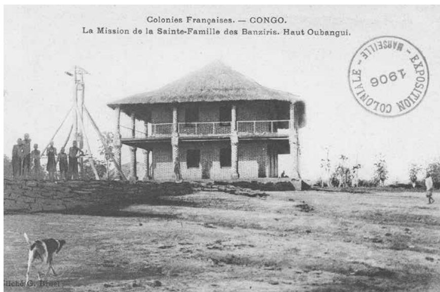
Fig. 1 – « La Mission de la Sainte-Famille des Banziris (Haut Oubangui) » (Collection D. Carité)

Il serait vain de tenter de restituer dans ces lignes la complexité du cadre historique et social des populations sur lesquelles s'étendaient les