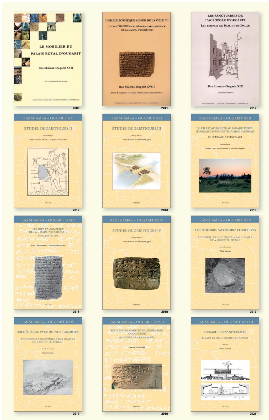
Fig. 1 – Couvertures des douze volumes de la série Ras Shamra – Ougarit parus depuis 2008 (infographie G. Devilder).