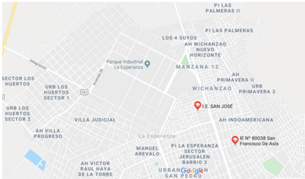
Figura 1. Mapa de ubicación de la institución educativa – La Esperanza (Trujillo-Perú), 2019