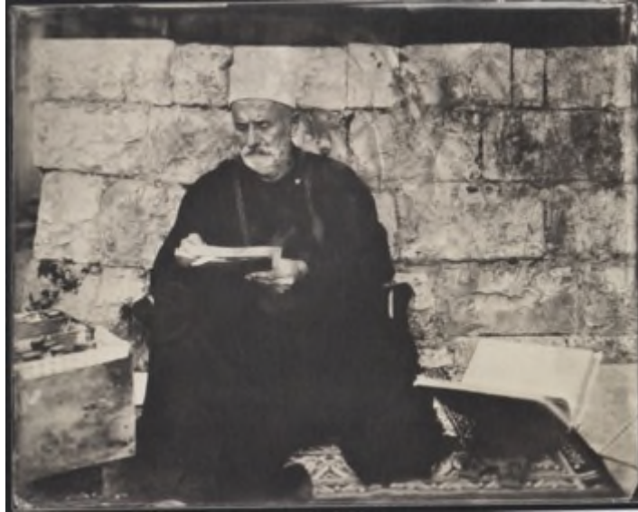
Fig. 5- « The Calligrapher », Hasbaya, novembre 2018

La copie a une fonction performative en ce qu'elle participe de la transformation du religieux dans le Livre et, à travers le texte qu'il va ainsi confier à un druze aspirant, d'inscrire chaque druze dans le cycle des perfectionnements-réincarnation qui en assure la permanence cosmologique. Elles portent probablement la marque de chaque copiste qui peut y ajouter des dessins, utiliser des encres de couleur différentes pour en enjoliver le texte et en marquer les scansiones (« yaqûl... il dit » inscrit à l'encre rouge dans les clichés ci-dessous) ou marquer des ruptures par l'insertion de dessins. Il est possible d'envisager que ce jeu sur les couleurs soit une forme d'écriture ésotérique jouant sur les cinq couleurs (bleu, blanc, vert, rouge, jaune) qui correspondent aux cinq « limites » ( budûd ) de l'ordre cosmique druze symbolisées dans l'étoile à cinq branches qui est un signe de reconnaissance druze.