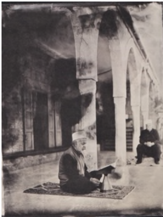
Fig. 3 – « Closer to God. Khalwat al-Bayyada »

Eleanor Armanet a particulièrement bien saisi ce double travail « d’anthropologisation du livre et de la textualisation de la personne humaine » qui s’opère dans le traitement matériel du livre