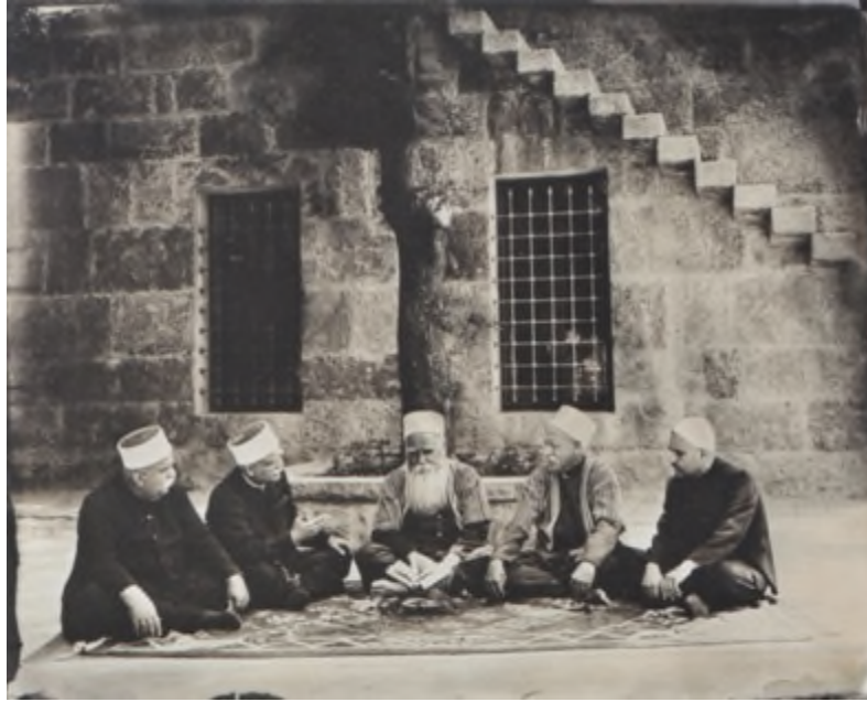
Fig 1- « Jalsa roubania . Khelwet Jornaya ».