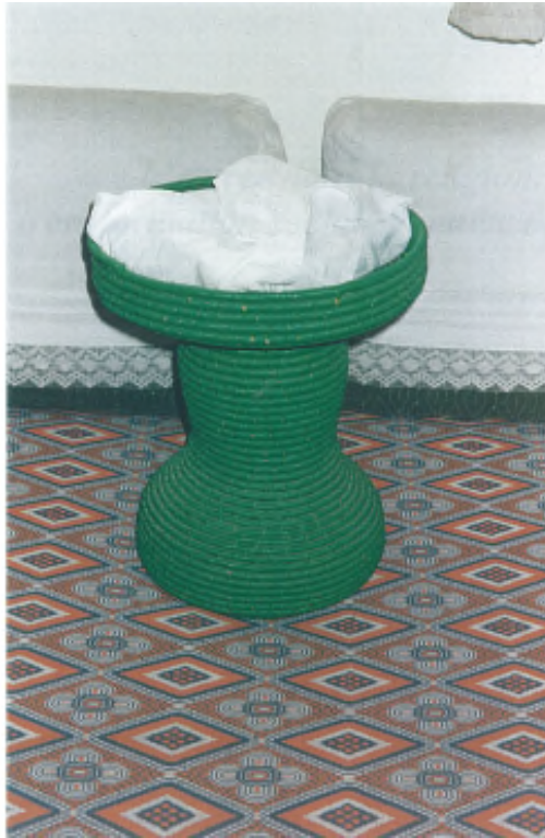
Fig. 2- Kitâb al-hikma emmailloté sur son tabaq .