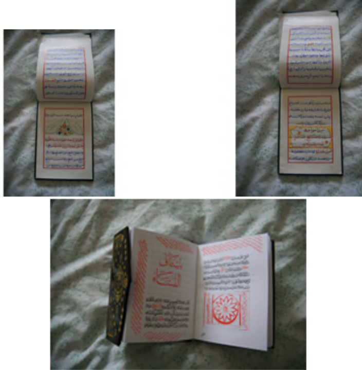
Fig. 6- Exemple de calligraphie religieuse (« les enseignements du shaykh Al-Fadîl ») et le « Mithâq al-nisâ »

Cette « œuvre de bonté » a néanmoins un coût et l'on estimait en 2000 qu'une copie pouvait s'élever à 300 dollars US en don fait à la congrégation. Ces copies sont alors conservées dans les chambres à coucher, rangées dans les commodes où sont pliées les foulards ou enfermés dans les tables de nuit. Il n'est pas nécessaire d'être devenu religieux pour en posséder une copie. Le livre ainsi rangé dans l'intimité du couple joue alors pleinement sa fonction de sacralisation d'un espace. Il est une présence du religieux communautaire dans le foyer et peut-être aussi une présence rappelant à chaque druze la finalité de son parcours individuel en tant que druze, quand il conviendra de quitter progressivement les affaires du monde pour s'en approcher.