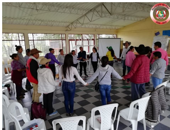
Illustration. Atelier de formation pour les proches des personnes « disparues » et la communauté de Páez, Miraflores et San Eduardo (Colombie)

Ces pratiques s'autorisent et se renforcent l'une l'autre, notamment en venant à constituer une alternative identifiée aux modalités classiques, élitaires et politiques, d'établissement de la paix. On le voit dans l'illustration ci-dessous : un atelier de formation, mobilisant des techniques ludiques d'animation en petits groupes, articule identités de victime, de « survivant » et de travailleur, ainsi que mots d'ordre de paix et de justice. L'activité en miroir ou conjointe fait émerger un intérêt commun chez des personnes et des groupes disparates, et ainsi propage des techniques sans pour autant imposer leur complète unification.