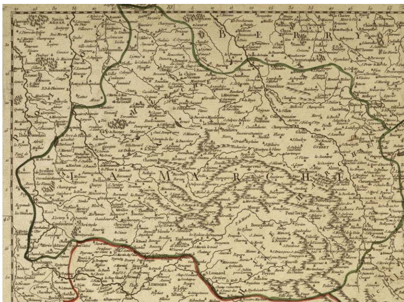
La province de la Marche au XVIII e siècle 9

siècles) et le reste du Royaume de France. Au sein de La Marche, on distinguait la Haute-Marche, correspondant peu ou prou à l'actuel département de la Creuse, dont la capitale était Guéret, et la Basse-Marche, correspondant à la partie nord de la Haute-Vienne et au sud de l'Indre, dont la capitale fut Bellac puis Le Dorat (Berducat 2010 : 19).