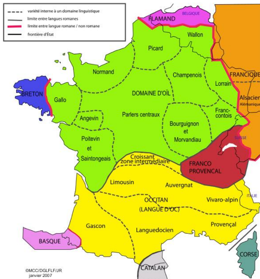
Les langues gallo-romanes et la zone du Croissant