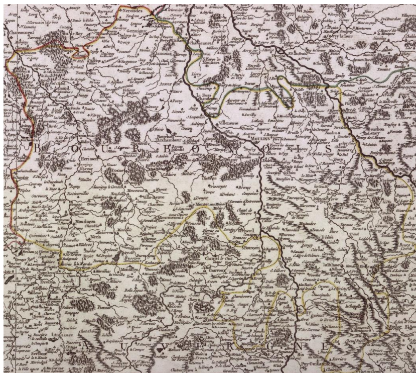
La province du Bourbonnais au XVIII e siècle 10

Le Duché de Bourbon (ou Bourbonnais) est une ancienne province de France, supprimée après la Révolution. Le Bourbonnais était situé entre le Berry (au nord-ouest), le Nivernais (au nord), la Bourgogne (à l'est), l'Auvergne (au sud) et la Marche (au sud-ouest).