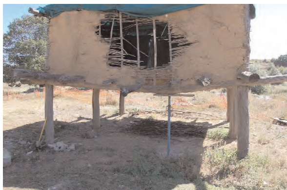
Fig. 14 : Etaient provisoire du sommier brisé en deux.

bras de levier, c'est-à-dire un long bastaing cloué au poteau, prenant appui à son extrémité et levé par l'autre extrémité (fig. 17). Le poteau, ainsi levé et positionné en tête correctement, en pression sur les cales de bois et le sommier, des pierres de calages ont été intro-