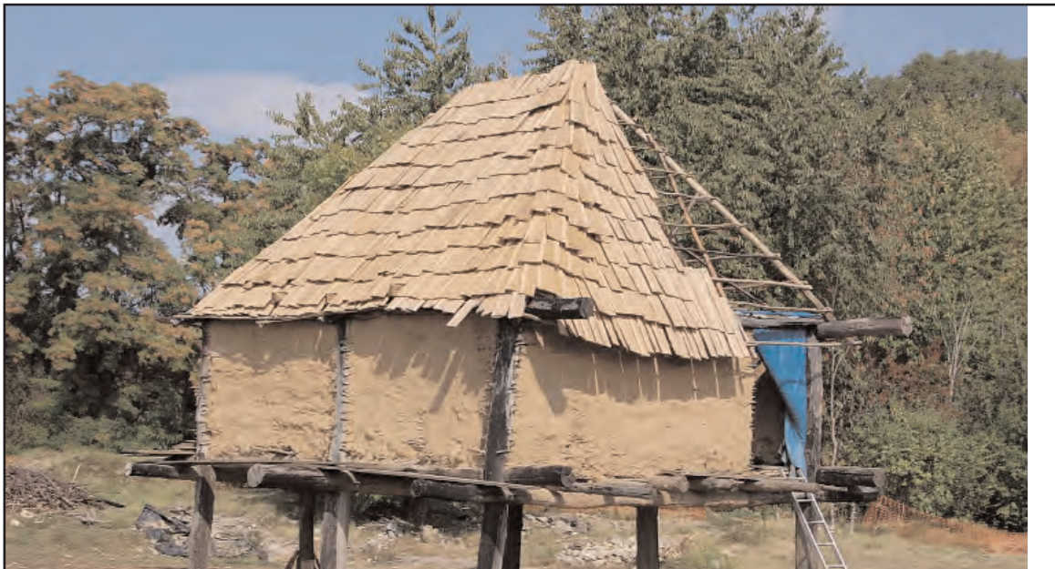
Fig. 22 : Pose des bardeaux.