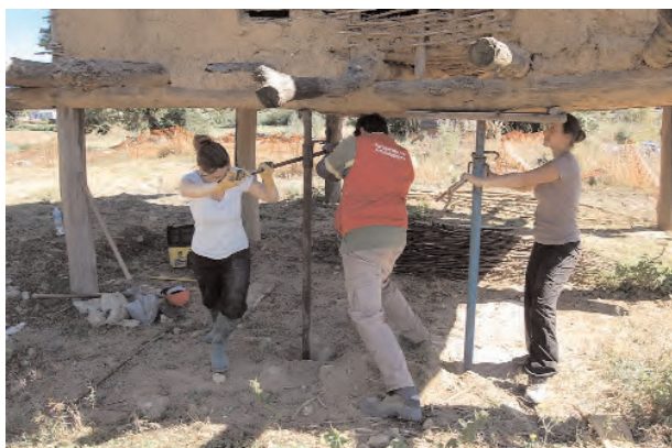
Fig. 15 : Redressement des deux parties du sommier.

bras de levier, c'est-à-dire un long bastaing cloué au poteau, prenant appui à son extrémité et levé par l'autre extrémité (fig. 17). Le poteau, ainsi levé et positionné en tête correctement, en pression sur les cales de bois et le sommier, des pierres de calages ont été intro-