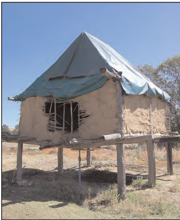
Fig. 11 : Etat du grenier après les actes de vandalisme du printemps 2009.

l'occasion de réaliser des observations intéressantes pour l'analyse des plans au sol de trous de poteaux. En effet, le plan actuel du grenier présente six trous de poteaux symétriques. Pour étayer le sommier, un trou supplémentaire a été creusé à la verticale du point de rupture du sommier, sur 1 m de profondeur (autant que les TP des poteaux principaux) pour y insérer un poteau fourchu en tête, de 20 cm de diamètre. Sa mise en place