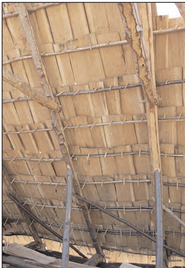
Fig. 23 : Fixation des bardeaux par chevillage en butée sur le lattis.

et ils étaient fixés par une cheville travaillant en butée sur le lattis. A Neuvy-deux-clochers, ils mesurent entre 65 x 15 cm et 72 x 25 cm, de 1 à 2 cm d'épaisseur, et sont obtenus par débit radial de billes de chêne à croissance lente, avec le même système de fixation.