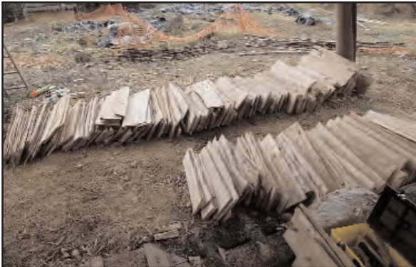
Fig. 20 : Tri au sol des bardeaux selon leur largeur.

Neuvy-deux-clochers 2 dans le Cher ou à Pineuilh 3 en Gironde. A Pineuilh, les bardeaux retrouvés mesurent entre 70 et 80 cm de longueur pour des largeurs comprises entre 18 et 25 cm et une épaisseur variant de 1,5 à 2,5 cm. Leur extrémité inférieure est arrondie