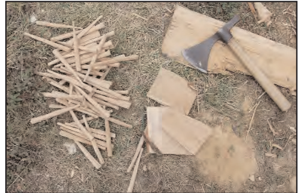
Fig. 21 : Préparation des chevilles à la hachette.