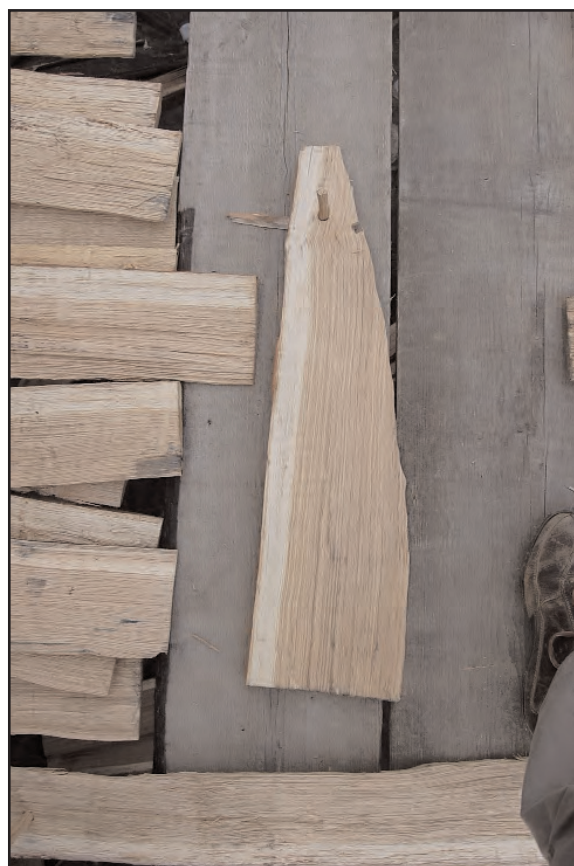
Fig. 24 : Taille biaisée des bardeaux d'arêtier.

En 2009, concernant le couvrement du grenier, l'expérimentation a consisté à réaliser le lattis de la couverture, en perche de noisetier, à terminer la fabrication des bardeaux issus des billes du chêne abattu l'année précédente, et d'en effectuer la pose. A l'issue du chantier, 370 bardeaux ont été fabriqués, à partir donc des 14 billes et d'une seule grume de chêne. Leur pose a été réalisée avec un pureau apparent d'un tiers du bardeau et leur fixation avec des chevilles travaillant en butée sur le lattis. Une bille entière a été débitée à la hache pour la fabrication des chevilles (fig. 21).