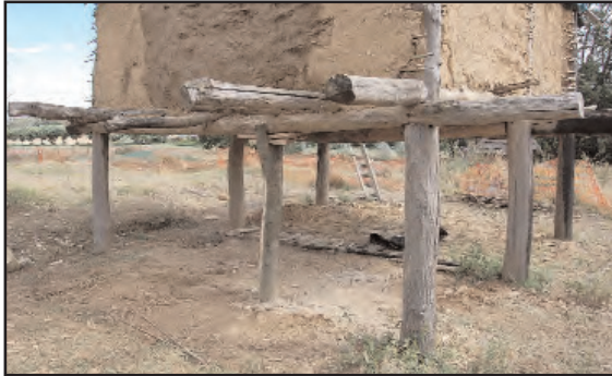
Fig. 18 : Vue du poteau d'étaie, après sa mise en place.