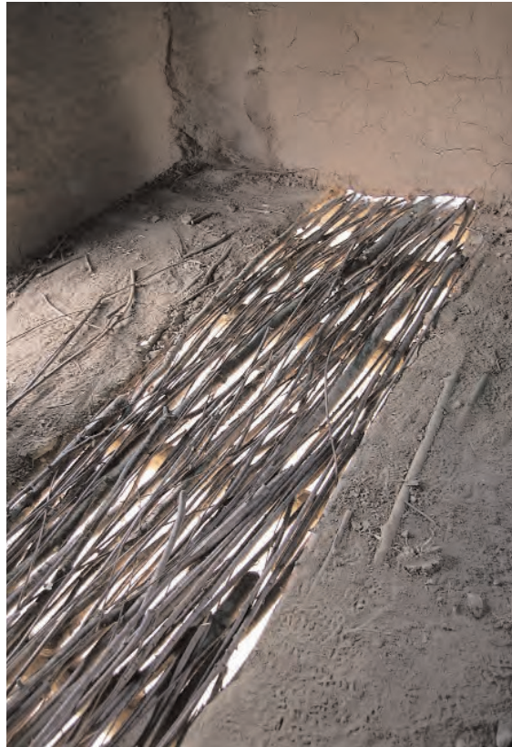
Fig. 12 : Réfection du sol avec pose de perches en châtaigniers et recouvrement en torchis.

L'usage de ces étais métalliques étaient indispensables en raison, d'une part, du poids du sommier sur lequel s'appuyait la cloison en torchis et, d'autre part, des moyens dont nous disposions. Pour respecter l'éthique d'une réelle expérimentation, nous aurions dû utiliser des poteaux à bras de levier, comme nous pûmes le faire pour l'opération suivante, mais le risque que représente de tels bras de levier (rupture du bras en bois) et l'absence de prévision de cette réparation nous ont obligé à