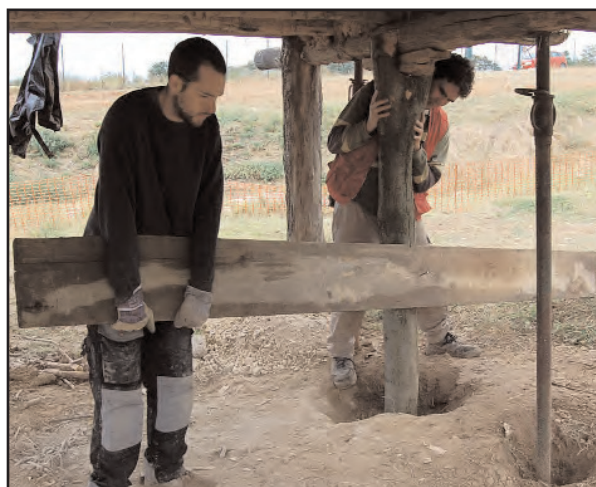
Fig. 17 : Levage et calage définitif du poteau avec un bras de levier.

Concernant la couverture, en 2008, nous avons opté pour une couverture en bardeaux de chêne, attestée par les textes sur les églises aux Xe-XIe siècles 1 et par l'archéologie sur des habitats aristocratiques aux Xe-XIIIe siècles, comme à