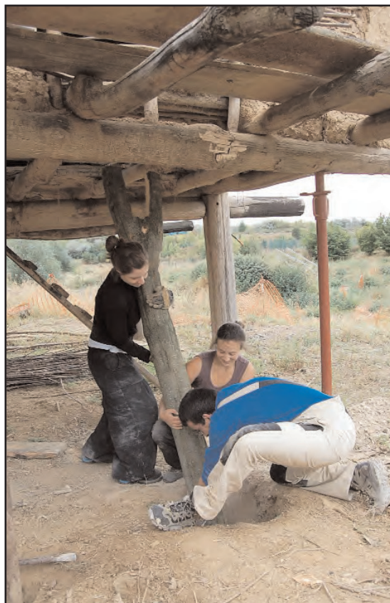
Fig. 16 : Mise en place du poteau fourchu dans son trou de calage.

Des travaux de réfection de la toiture ont également été réalisés en 2009 comme la reprise des assemblages, la réalisation des deux croupes en bois de frêne simplement écorcé et la mise en place de jambes de force sur les trois fermes et aussi sur les arêtiers afin de rigidifier le che-