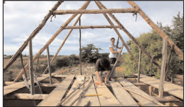
Fig. 19 : Mise en place des arçonniers et des jambes de force.

Neuvy-deux-clochers 2 dans le Cher ou à Pineuilh 3 en Gironde. A Pineuilh, les bardeaux retrouvés mesurent entre 70 et 80 cm de longueur pour des largeurs comprises entre 18 et 25 cm et une épaisseur variant de 1,5 à 2,5 cm. Leur extrémité inférieure est arrondie