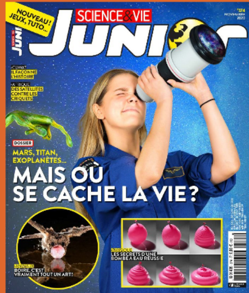
Science & Vie Junior , octobre 2020.