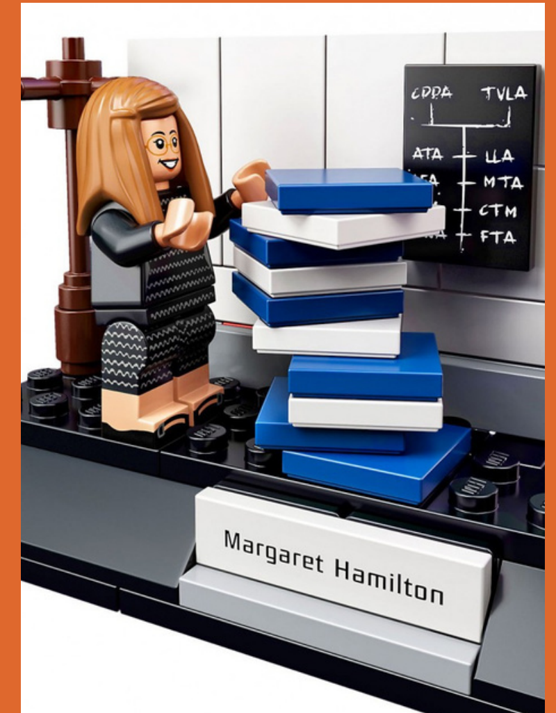
Women of NASA par LEGO, 20158.