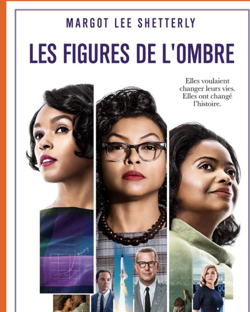
Film Les Figures de l'ombre , 2016