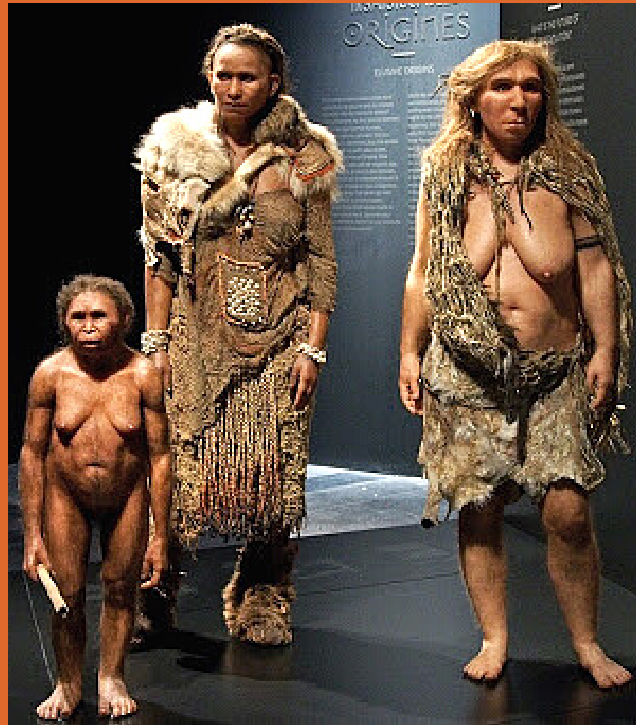
Femmes florès, sapiens et néandertalienne. Elisabeth Daynès pour le Musée des Confluences de Lyon (2013).