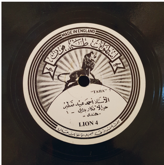
Fig. 14. Tahaphon, Ahmad 'Ubayd al-Qa'tabi, Hayyar al-afskār badri.

Cette pochette contient de la publicité pour un magasin qui vendait non seulement des disques et des phonographes, mais aussi de nombreux articles sans rapport avec la musique : des radios, des pneus, des batteries, des lanternes, etc. Cette diversification des activités commerciales, signe d'une activité prospère, est sans doute l'une des raisons du succès de cette famille hors normes qui réussit à transcender des événements aussi dramatiques que ceux de la guerre dans le domaine de la musique : elle avait une solide assise commerciale. Mais Ṭaha Muḥammad Ḥamūd était également propriétaire de plusieurs salles de cinéma (comme son père et son grand-père) et avait fondé plusieurs radios locales qui existaient avant Radio Aden 114 . Les pochettes et les étiquettes de cette compagnie, notamment leur graphisme, indique une période plus tardive que les précédentes, assurément après la guerre : pour la première fois, une compagnie yéménite a un logo figuratif, un lion rugissant, et c'est une photo (fig. 14).