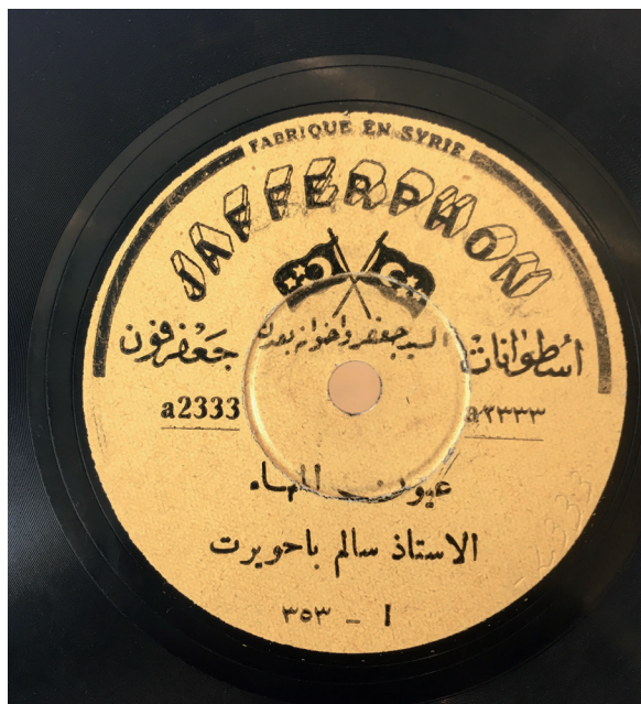
Fig. 10. Jafferphon, Sālim Bā Ḥuwayrit, ‘ Uyūn al-mahā (période Alep).