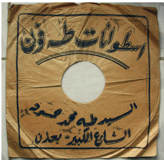
Fig. 12. Pochette de disque Tahaphon.