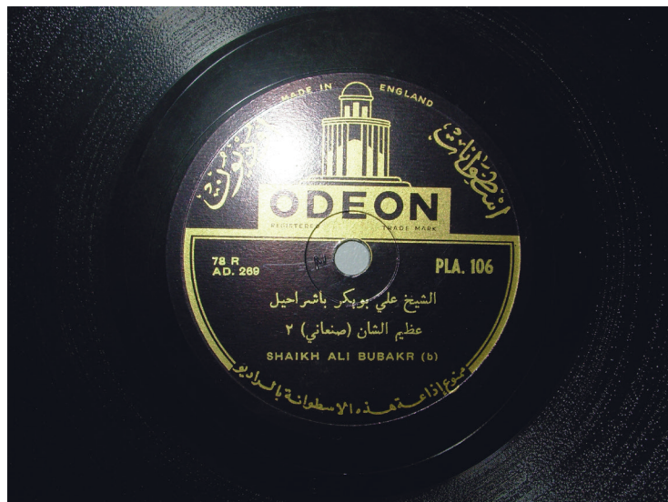
Fig. 2. Odeon, 'Alī Abū Bakr Bā Šarāhīl, 'Azīm al-šān . Made in England.