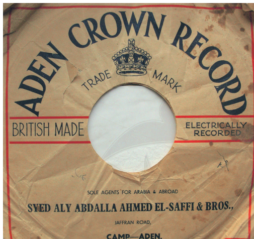
Fig. 4 et 5. Pochettes de disques Aden Crown.