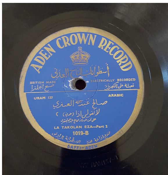
Fig. 6. Aden Crown Record/al-Tāġ al-ʿAdanī, Sāliḥ ʿAbdallāh al-ʿAntarī, Lā taqūlanna idā , ʿadanī. Étiquette bleue.