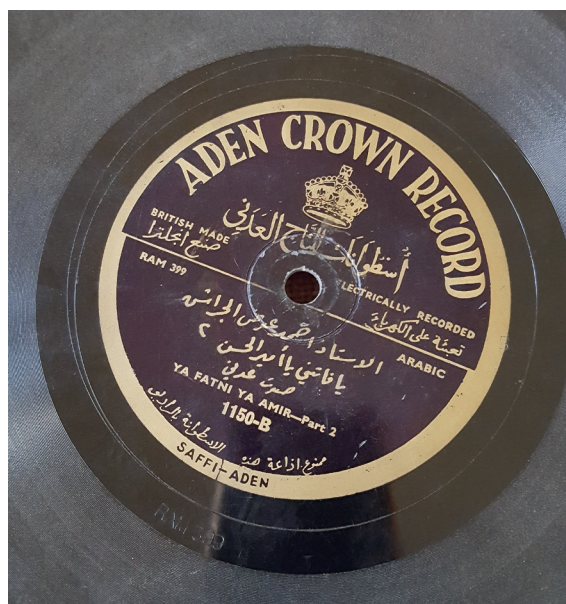
Fig. 7. Aden Crown Record, Aḥmad al-Ġarrās, Yā fātini yā amir al-ḥusn . Étiquette noire.

69. Durant le conflit opposant entre autres l'Allemagne et l'Angleterre, le transport maritime était devenu très difficile, et le risque commercial aurait été trop important. Par ailleurs, l'Angleterre bombardée, était toute entière mobilisée vers l'effort de guerre. La question de savoir si ces disques ne pouvaient pas être pressés en Inde reste ouverte : par exemple Gramophone/HMV avait une usine à Calcutta depuis au moins 1914. Mais pour l'instant, nous n'avons aucun indice allant dans ce sens.