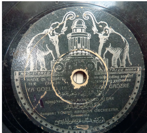
Fig. 19. Odeon, Muḥammad al-Bār, Yaqūl al-Hāsimī...

– À la fin des années 1950 (pas de date précise), des musiciens yéménites ont aussi été enregistrés au Pakistan, par exemple un certain Aḥmad Sa‘īd al-‘Adanī, label rose, Ismā‘īlphon, photo du musicien en médaillon 140 .