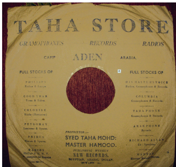
Fig. 13. Pochette de disque, magasins Tahaphon.

Cette pochette contient de la publicité pour un magasin qui vendait non seulement des disques et des phonographes, mais aussi de nombreux articles sans rapport avec la musique : des radios, des pneus, des batteries, des lanternes, etc. Cette diversification des activités commerciales, signe d'une activité prospère, est sans doute l'une des raisons du succès de cette famille hors normes qui réussit à transcender des événements aussi dramatiques que ceux de la guerre dans le domaine de la musique : elle avait une solide assise commerciale. Mais Ṭaha Muḥammad Ḥamūd était également propriétaire de plusieurs salles de cinéma (comme son père et son grand-père) et avait fondé plusieurs radios locales qui existaient avant Radio Aden 114 . Les pochettes et les étiquettes de cette compagnie, notamment leur graphisme, indique une période plus tardive que les précédentes, assurément après la guerre : pour la première fois, une compagnie yéménite a un logo figuratif, un lion rugissant, et c'est une photo (fig. 14).