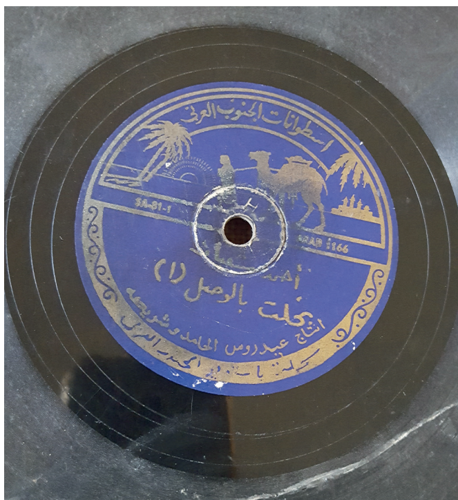
Fig. 16. Al-Ġanūb al-ʿArabī, Aḥmad Šībān, Baḥalt bi-l-waṣl .

Cette compagnie avait pour propriétaire un personnage mal connu, 'Aydārūs al-Hāmid, dont le nom figure sur les disques Arabian South, et qui était originaire du Ḥaḍramawt (Wādī Dū'an). Les étiquettes sont bleu roi (fig. 16), ce qui rappelle la couleur des étiquettes Kayaphon. Le logo est un chameau qui est conduit par un bédouin dans le désert, avec au loin un palais dont on imagine qu'il évoque les villes historiques du Ḥaḍramawt.