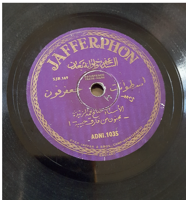
Fig. 9. Jafferphon, Sāliḥ al-Zabīdī, Maḡnūn man fāraq ḥabībah (période violette).

petit nombre de disques 101 . C'est seulement avec Tahaphon et al-Ġanūb al-ʿArabī que la musique du Ḥaḍramawt commencera à être enregistrée plus massivement, au début des années 1950.