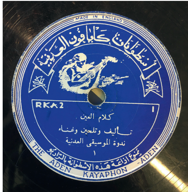
Fig. 15. Disque Kayaphon, Kalām al-'ayn , sans nom d'interprète.

Les numéros des disques suivent l'abréviation RKA, probablement pour Record Kayaphon Aden. Les étiquettes sont bleu roi. Toujours selon l'esprit militant du Club, ses fondateurs se refusaient de faire figurer le nom du musicien sur chaque disque. C'est ainsi que le disque Kalām al-'ayn (RKA 2) (fig. 15) n'a pas de nom d'interprète, alors que l'on sait par ailleurs que ce dernier était Ḥalīl Muḥammad Ḥalīl 125 .