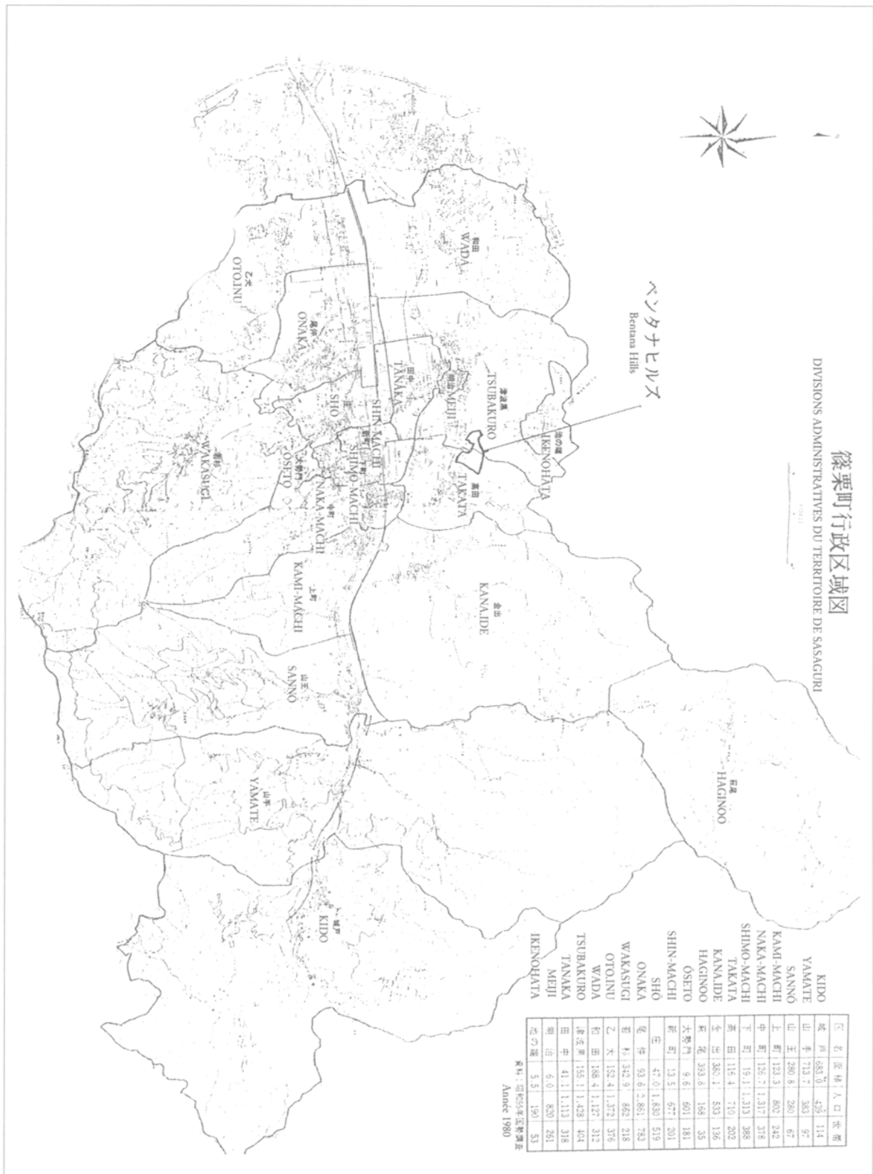
Carte 1 : Circonscriptions administratives de Sasaguri.