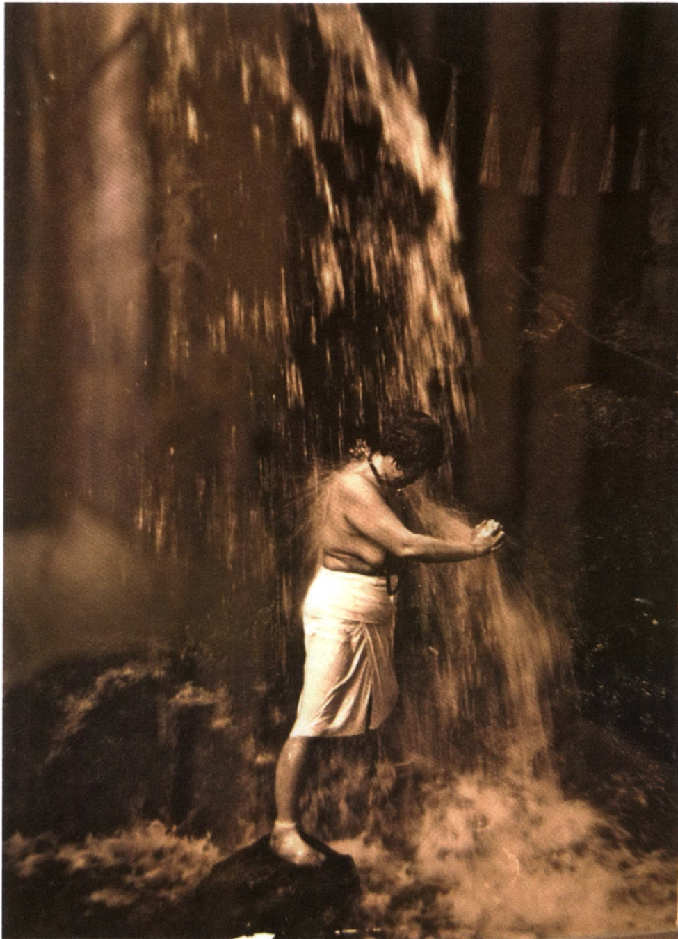
Fig. 2 : Femme sous la cascade à Sasaguri. (Photographie d'avant-guerre. Centre de documents historiques et de matériaux ethnographiques de Sasaguri)

et de 100 personnes venues de Shimonoseki 下関. Parmi eux étaient particulièrement célèbres celui de Kanbara 神原 du nouveau mont Narita 新成田山 de Saga et celui d'Onoda 小野田 mené par un guide appelé Matsuoka 松岡. Tous pratiquaient l'ascèse de la cascade sous la conduite de leurs responsables, qui en avaient reçu l'ordre par des oracles. Ils appelaient cela « la pratique/ascèse » ( ogyō お行) ou la « pratique/ascèse de la cascade » ( takigyō 滝行) (fig. 2).