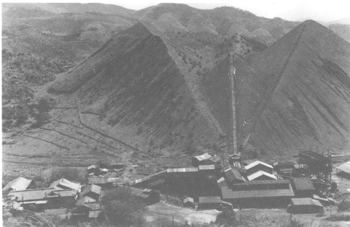
Fig. 5 : Terril de Sasaguri (1961, à la fermeture de la mine).

Après la guerre, la loi sur la sécurité minière interdit de travailler nu. Il fallait porter des manches longues, un pantalon et des gants. Après 1955, vinrent s'y ajouter le casque et les chaussures de protection à armature de fer. Avant la guerre, là où il faisait le plus chaud, on ne portait même pas de cache-sexe ( fundoshi 褌) car, avec la poussière, cela nous irritait la peau. Plus la galerie est profonde, et plus la chaleur est élevée. Tous les 30 mètres, la température monte d'un degré.