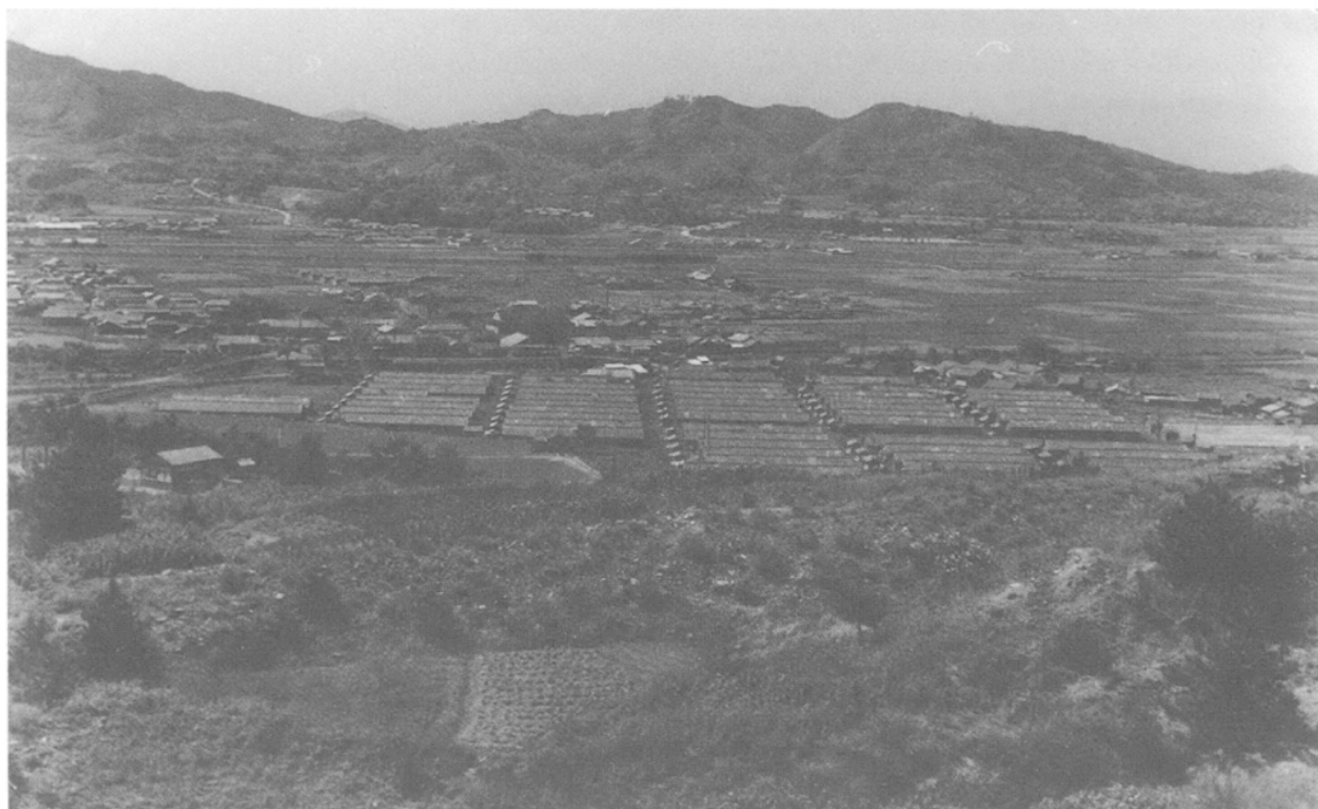
Fig. 6 : Les habitations (« baraquements ») des mineurs à Takata. (Archives du Centre de documents historiques et de matériaux ethnographiques de Sasaguri)

une porte de service. Des logements de cette taille étaient alignés en rangées de 3 ou 4. À l'extérieur, se trouvaient les toilettes à usage commun.