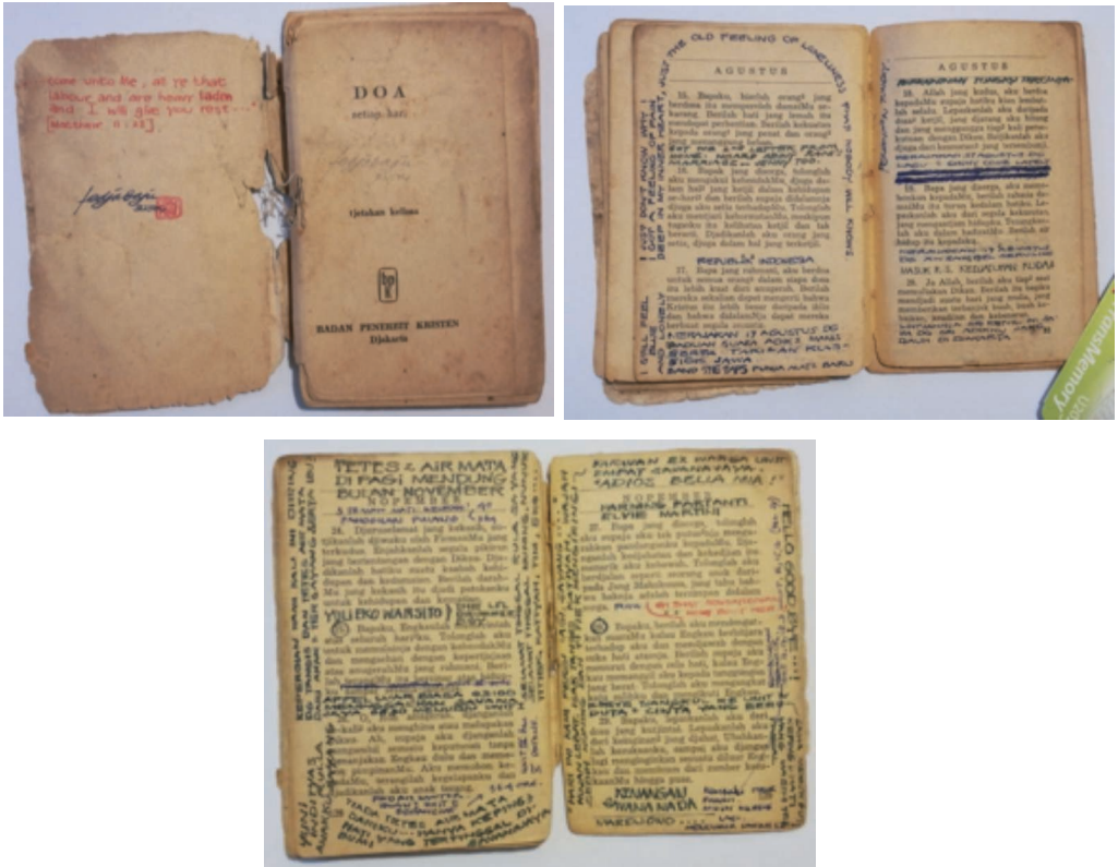
Fig. 3-4-5 – Le recueil de prières annoté par Tedjabayu. (Photos HCL, nov. 2018)

Les deux extraits traduits ci-dessous illustrent de façon spectaculaire cette volonté de tirer le meilleur parti possible des conditions abjectes dans lesquelles il est amené à passer les quatorze premières années de son âge adulte. Dans le premier extrait, au tout début du récit, il relate son arrestation, avec 125 autres jeunes « communistes », le 20 octobre 1965 : ils n’ont aucune inquiétude : les militaires les emmènent dans une caserne afin de les mettre à l’abri d’une foule en délire ; ils chantent dans le camion qui les emporte, inconscients de la spirale concentrationnaire dans laquelle ils sont engagés. Le deuxième extrait rapporte la libération de Buru, le retour à Java en bateau et les retrouvailles avec la mère de l’auteur. L’attitude théâtrale de celle-ci souligne magnifiquement l’impuissance des citoyens sous une dictature et la volonté inflexible de conserver sa dignité en dépit des humiliations subies. Aux deux extrémités de ces deux extraits, au premier comme au dernier jour (le départ de son domicile pour la prison et le retour à Java après sa libération) se dresse la figure emblématique de la mère,