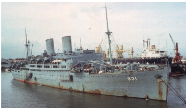
Fig. 7 – Le Tanjung Pandan, navire 931 de la Marine indonésienne.

elle avait aidé beaucoup d'entre eux au quotidien, particulièrement, bien sûr, ceux qui faisaient constamment l'aller et retour Namlea-Mako. Elle avait une fille, jeune veuve qui avait épousé un militaire originaire de Java. Son enfant de son premier mariage, une gentille fille de 17 ans, était donc la belle-fille d'un soldat du Bataillon 731.