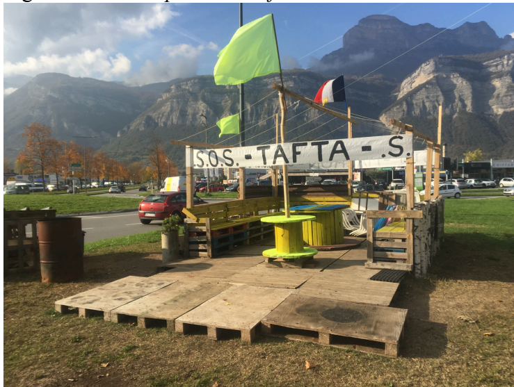
Figure 3. Le rond-point du Rafour au 30 octobre 2019

Les soirs d'assemblée, l'éclairage avec un projecteur alimenté par un groupe électrogène renforce encore cette mise en scène, faisant ressembler le rond-point à un îlot, une oasis dans la nuit. Les gilets jaunes disent bien son intérêt premier : « il est connu dans le secteur ; des milliers de personnes passent à proximité venus de quatre directions » ; « on est visibles et on peut distribuer des tracts aux véhicules qui roulent doucement ». 27 200 véhicules dont plus de 900 camions 6 empruntent quotidiennement le rond-point avec le flots de nuisances liées (bruit, odeurs, pollution...) qui n'en font pas le milieu le plus favorable à une installation dans une vallée au climat contrasté. Pourtant, le site est fréquenté avec des qualités qui expliquent sans doute sa pérennité. Sur quelques mètres carrés au bord de la départementale, se pressent de 20 à 60 personnes selon les jours. En journée, le site est habité, avec ses habitués, ses rythmes et des pics de fréquentation en soirée, les Assemblées générales du mercredi et les actions du samedi. Les gilets jaunes transforment le « lieu » et le « lieu » les transforme, les façonne en retour.