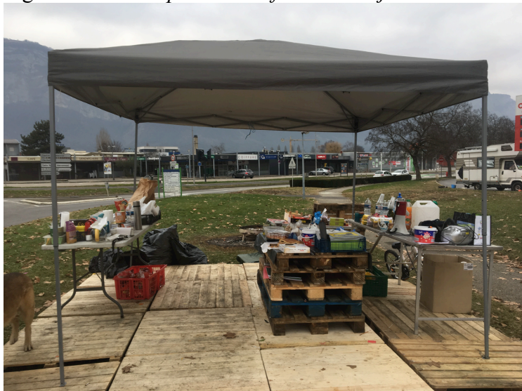
Figure 2. Le rond-point du Rafour au 1er janvier 2019

L'aménagement s'est fait de manière progressive au fil des propositions des gilets jaunes présents. Dès fin décembre 2018, le sol boueux a été recouvert d'un plancher de palettes. Les qualités d'artisan de nombre d'entre eux, le matériel disponible dans les camionnettes de chantier garées sur la parking derrière, ont facilité la construction. Les aménagements ont fait l'objet de débats en assemblée générale. Les arguments étaient de trois ordres : « il faut protéger les femmes et les anciens des intempéries » ; « nous devons prendre soin d'un lieu