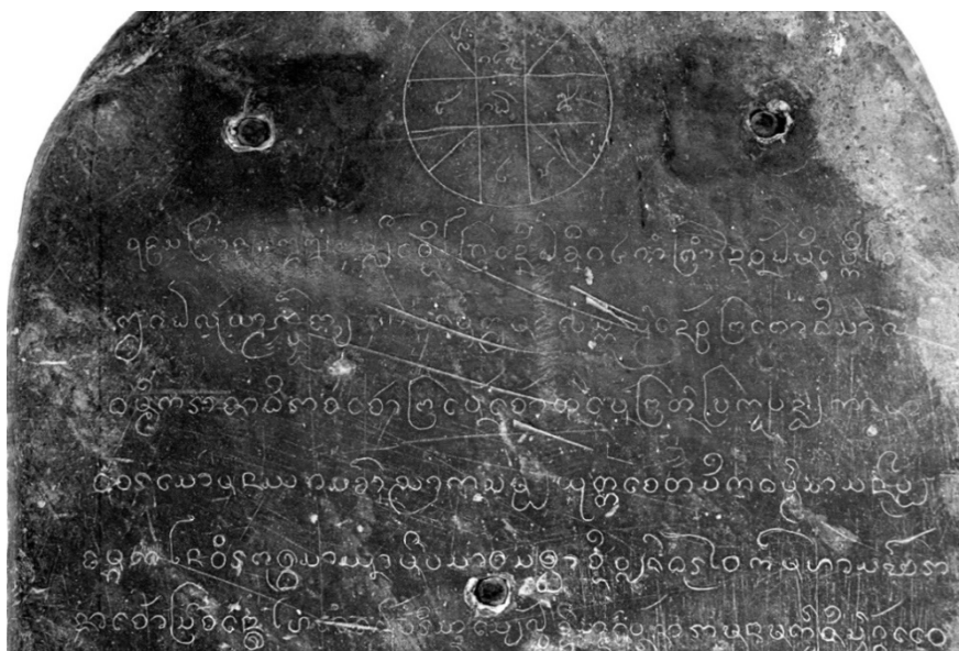
Fig. 1. Stèle du Vat Sangkhalok, Luang Prabang, 1527 (partie supérieure)

année 17 . Deux de ces huit stèles – celle du Vat Sangkhalok (Luang Prabang), datée de 1527 (cf. fig. n° 1), et celle du Vat Daen Muang de Phon Phixay, datée de 1535 (cf. fig. n° 2) – apparaissent explicitement comme des ordonnances royales de ce souverain.