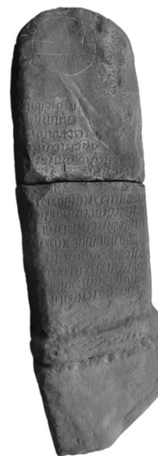
Fig. n° 6. Stèle-sema, Ban Vieng Kham

bouddhique ou hindouiste qui, bien que déconnectés de la pratique culturelle originelle, eurent probablement un impact très fort sur leur conscience collective (cf. fig. n° 7). C'est cette « mémoire » tangible d'un passé ancien exceptionnel qui explique sans doute le caractère particulier de la tradition hagiographique lao ( Histoire du Phra Bang, Urangkhathat ), mais aussi celui de la tradition historiographique qui en dérive pour une grande part. D'où le récit des plus anciennes chroniques de Luang Prabang qui font remonter l'introduction du bouddhisme au règne de Fa Ngum (1353-1374), en le faisant curieusement venir, comme nous l'avons déjà vu, du lointain Cambodge. D'où également ce passage assez mystérieux du Nithan Khun Borom , texte datant du XVI e siècle, qui indique que la fameuse mission religieuse khmère s'arrêta quelques jours à Vientiane, où elle se fit montrer par les plus anciens habitants de la ville des sites dont le nom avait été gravé dans la pierre depuis le commencement des temps, à Inthapatha Nakhon (Angkor). On peut alors facilement identifier parmi ces sites ceux du That Luang et de Saphang Mo, où un certain nombre de vestiges khmers ont effectivement été retrouvés.