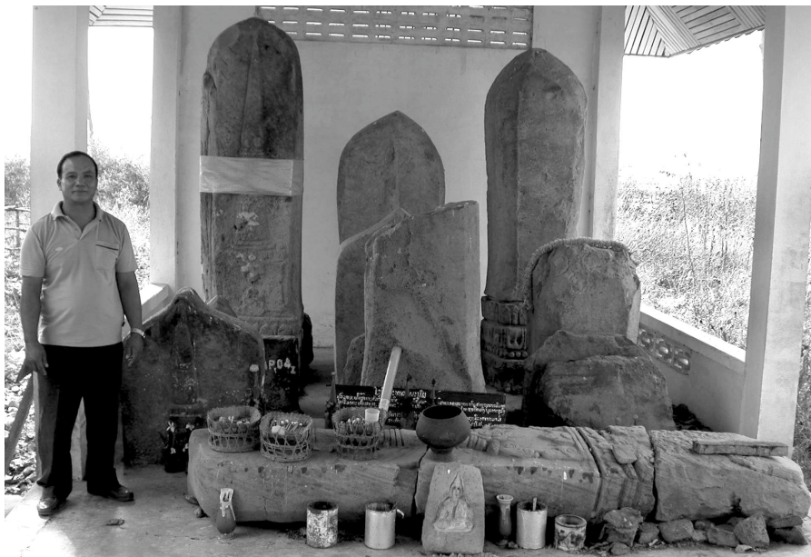
Fig. n° 3. Sema bouddhiques môns, Ban Kang, province de Savannakhet

taillés et apprêtés, tels que stèles et piédroits de monuments, ont alors également servi pour la gravure d'inscriptions lao 21 .