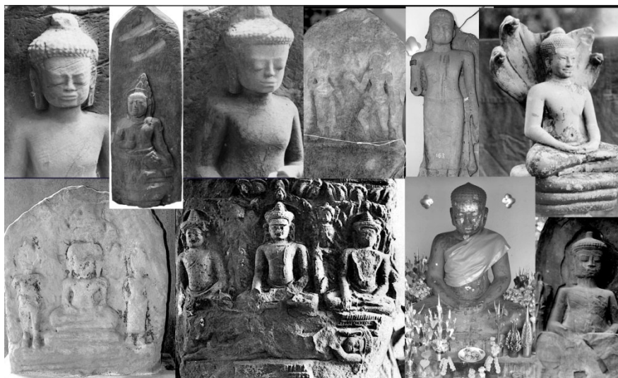
Fig. n° 7. Images bouddhiques mônes et khmères, province de Vientiane et Luang Prabang

D'une façon significative, l'historiographie de l'ancien royaume phuan de Xieng Khuang situe quant à elle l'introduction du bouddhisme au XV e siècle et le fait venir de Luang Prabang, voire d'une région plus à l'ouest. Aucun vestige khmer ou môn ne peut être trouvé à Xieng Khuang, alors que bien au contraire l'influence du Lān Nā et de la Birmanie y est attestée par un certain nombre d'objets. Les Phuan de la haute région septentrionale n'ont pas eu le même rapport au substrat que les populations lao riveraines du Mékong.