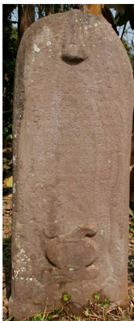
Fig. n° 4. Stèle-sema, Vat Si Phoum, Muang Sanakham