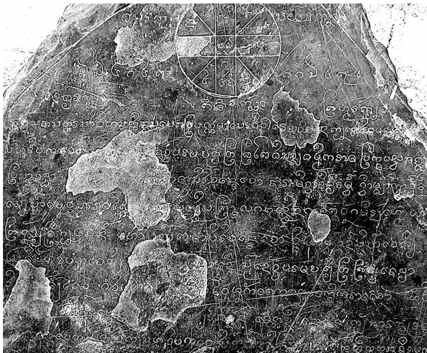
Fig. n° 8. Stèle du Vat Ban Dong Sin, Luang Prabang, 1555

des Trois Joyaux et de toutes les conceptions et dispositions mentales qui s'y rattachent. Le bouddhisme vient par ailleurs se substituer à des croyances antérieures jugées barbares et violentes – celles dans les génies et esprits de toutes sortes – y compris en investissant les places qui leur étaient consacrées, après des rites de purification 22 .