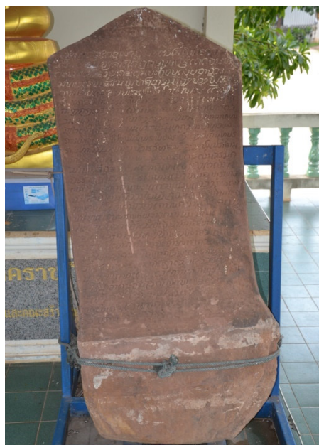
Fig. 2. Stèle n° 2 du Vat Daen Muang, Phon Phixay, 1535