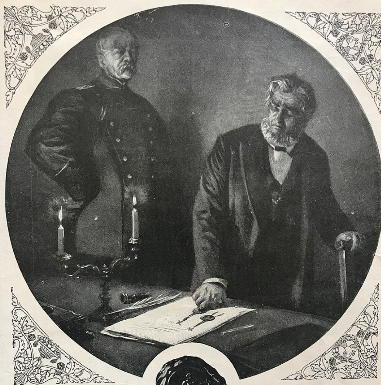
JULES FAVRE SCELLANT LE TRAITÉ DE FRANCFORT (1871), AVEC LA BAGUE QUE LUI AVAIT DONNÉE NAUNDORF.