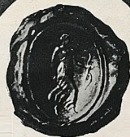
CI-CONTRE LA PHOTOGRAPHIE DE CE SCEAU, PRISE SPÉCIALEMENT AU MINISTÈRE DES AFFAIRES ÉTRANGÈRES.

Jules Favre putting his seal on the Treaty of Frankfurt