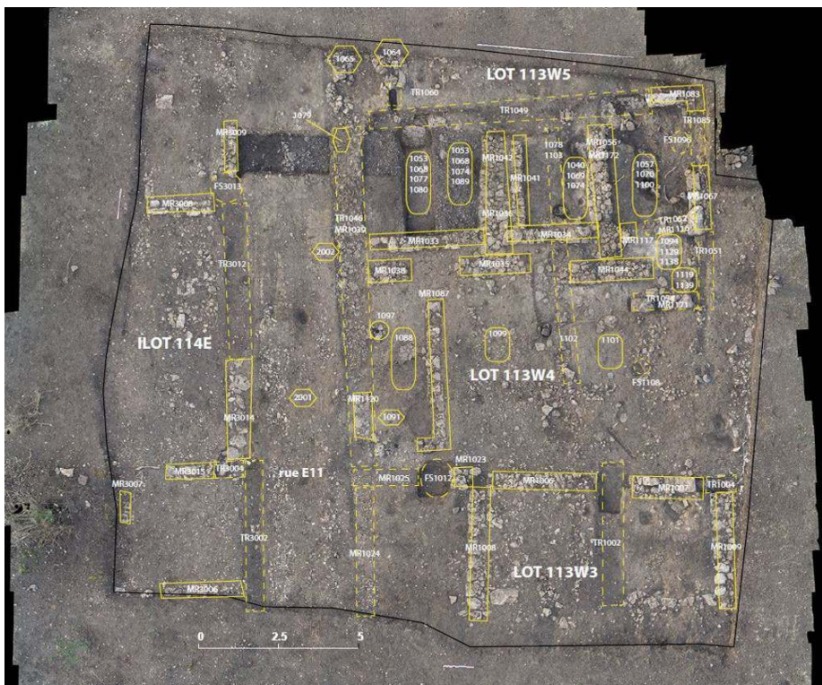
Fig. 2 – Orthophotoplan de la fouille 2018 avec mise en évidence des structures.

L. Damelet, Fr. Fouriaux, F. Mège, H. Tréziny.